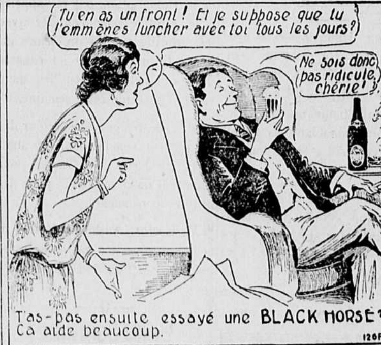
Tu en as un front! Et je suppose que tu l'emmènes luncher avec toi tous les jours?