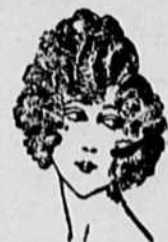
Pour cheveux longs et courts

Bouclant la boucle, le boucleur Boucle fortement sa ceinture; Bouclant la boucle, le coiffeur Donne du charme à sa coiffure Avec un "Kiondule" Qui boucle et qui ondule. L'art, dans le bouclerment, N'est plus qu'amusement. Un seul "KIONDULE" appareil suffit pour se faire des boucles et des ondulations à l'infini... simple, pratique.