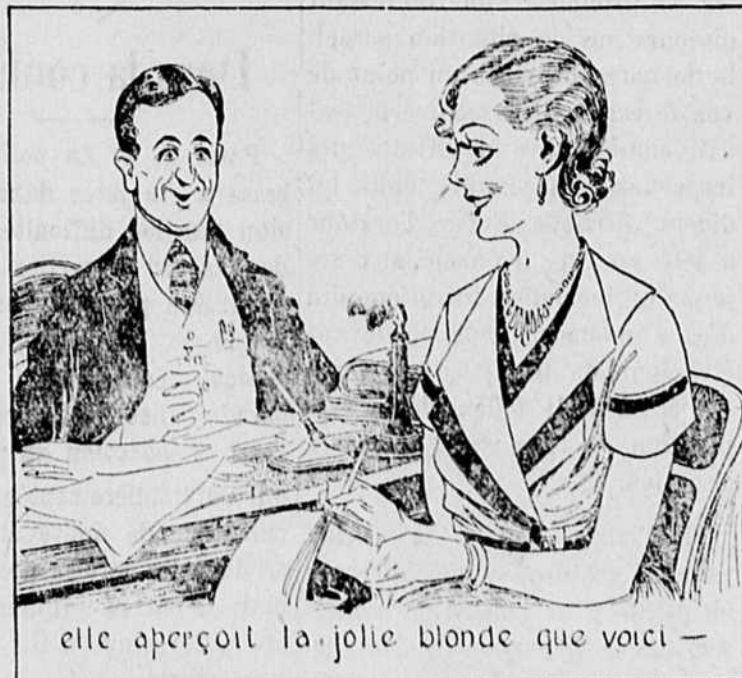
elle aperçoit la jolie blonde que voici —