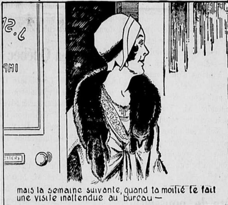
mais la semaine suivante, quand ta moitié te fait une visite inattendue au bureau —