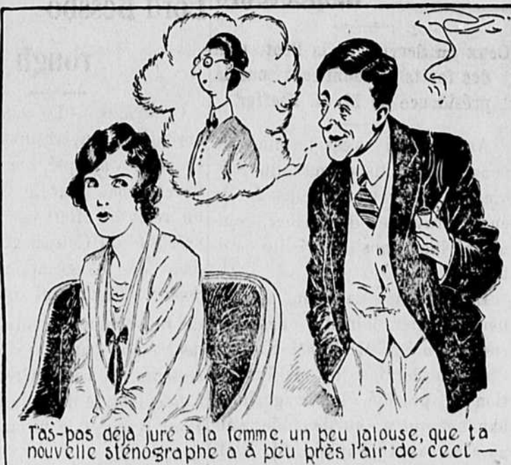
Tas-pas déjà juré à la femme, un peu jalouse, que ta nouvelle sténographe a à peu près l'air de ceci —