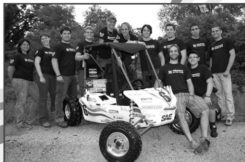
UNIVERSITÉ DE SHERBROOKE