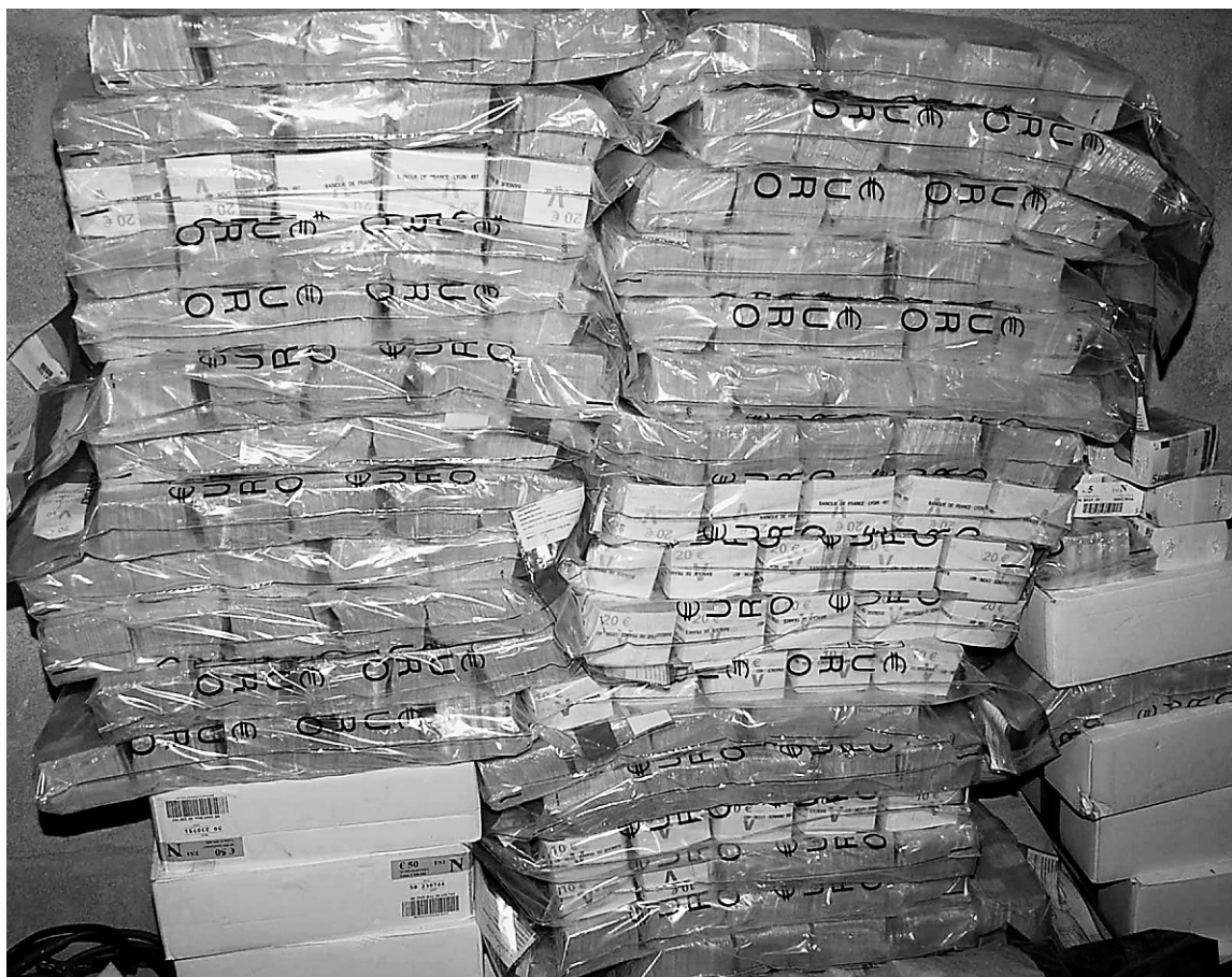
Sur cette photo fournie par la police française, on voit les 9 millions d'euros qui ont été récupérés sur les 11 millions qu'un convoyeur de fonds aurait détournés jeudi dernier.

Les policiers ont acquis la certitude que l'homme avait préparé son coup de longue