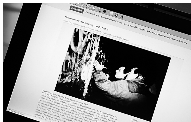
La page Facebook du président Nicolas Sarkozy suscite des réactions.

Dans son blogue, Alain Juppé a commencé par raconter que le soir du 9 novembre 1989, « il gelaît à pierre fendre.