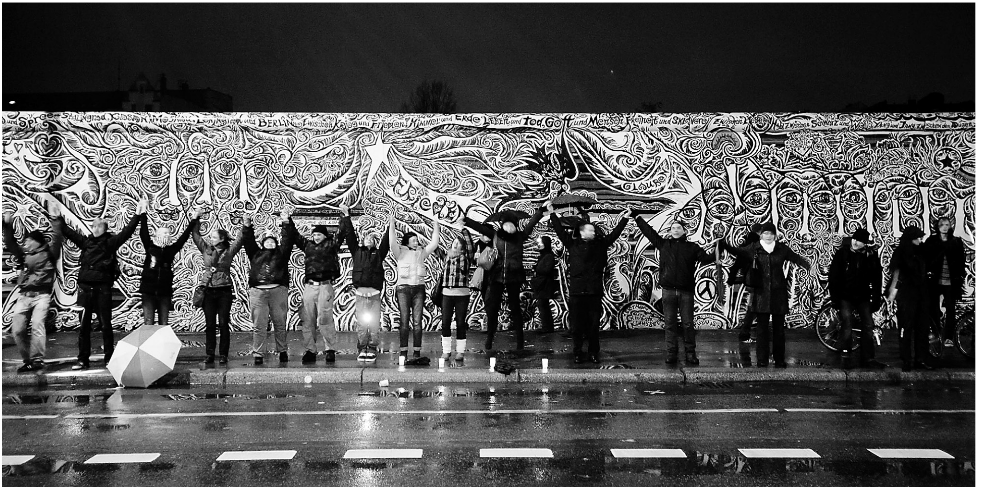
Devant la East Side Gallery du mur de Berlin, des volontaires forment une chaîne humaine pour marquer la chute du rideau de fer.