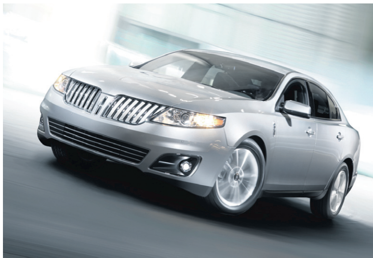
Propulsé par la technologie haut de gamme du moteur V6 EcoBoost, le Lincoln MKS offre aux conducteurs aussi bien le luxe d'une haute performance que celui d'une économie de carburant.

Dans un récent essai comparatif effectué par les magazines Automobile Magazine et Motor Trend, une MKS équipée d'un moteur V6 EcoBoost a été opposée à des concurrents