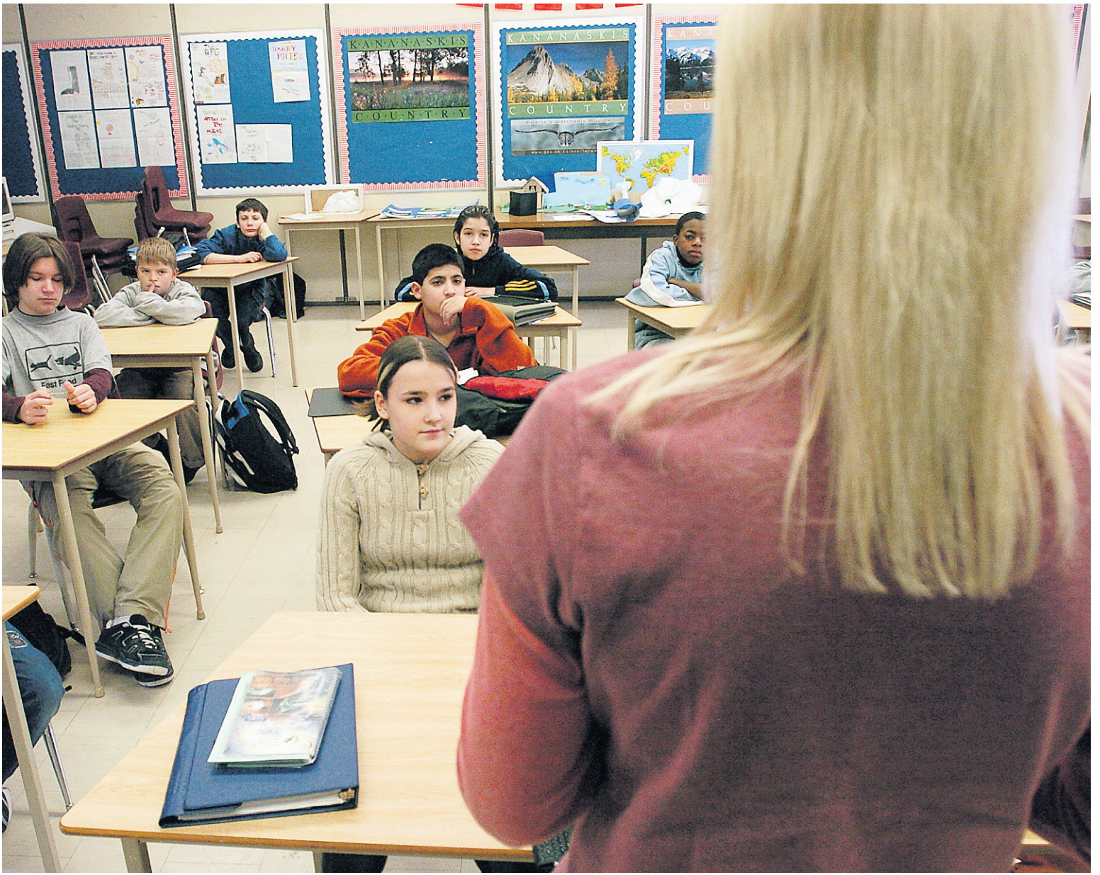
La semaine dernière, en banlieue sud de Montréal, la commission scolaire Marie-Victorin a enregistré de forts taux d'absentéisme tant chez ses élèves que chez ses enseignants. Ces jours-là, trouver des remplaçants a été difficile.

Selon lui, la situation semble pour l'instant maîtrisée à Montréal. «Nous avons une très grosse banque de remplaçants», dit-il.