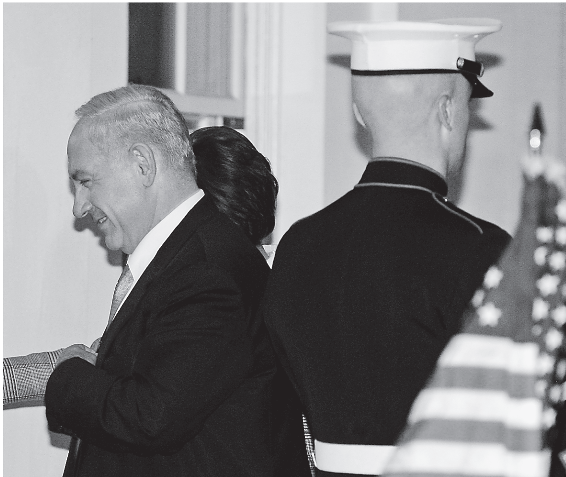
Le premier ministre israélien Benyamin Nétanyahou est arrivé à la Maison-Blanche hier soir pour un entretien avec le président Barack Obama. Washington n'a prévu aucune couverture médiatique, fait exceptionnel pour une rencontre entre le président américain et un haut dirigeant étranger, a fortiori quand il s'agit du premier ministre israélien.

«Je dis aujourd'hui à Mahmoud Abbas, le dirigeant de l'Autorité palestinienne: saisissons l'occasion