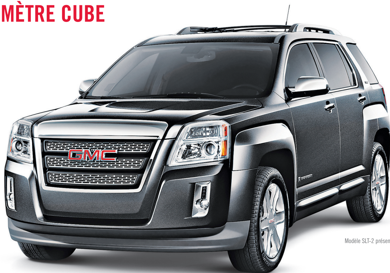
Modèle SLT-2 présenté

PDSF à partir de 27 465 $ | Financement à l'achat 2,9% jusqu'à 48 mois 2 | PLUS OBTENEZ 1 000 $ 3 EN BONI DES FÊTES