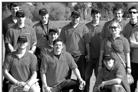
ÉCOLE POLYTECHNIQUE DE MONTRÉAL

Depuis 18 ans, un groupe d'étudiants de l'Université de Sherbrooke redouble d'efforts et de créativité afin de concevoir et fabriquer un petit véhicule tout-terrain monoplace en vue de participer à la compétition Baja, organisée par la Society of Automotive Engineers. Figurant aujourd'hui parmi les chefs de file de la compétition annuelle, les étudiants sherbrookoïsis réalisent un véhicule complètement nouveau à chaque année, assumant ainsi tous les aspects du développement du prototype, du choix du concept, de la fabrication, et ce, en seulement huit mois. Nécessitant engagement, discipline et persévérance, ce projet prépare les futurs ingénieurs à faire face aux défis techniques, organisationnels et humains du marché nord-américain. D'ailleurs, depuis 2006, la délégation de l'Université de Sherbrooke a réussi à se classer parmi les dix meilleures équipes à chacune des compétitions auxquelles elle a pris part.