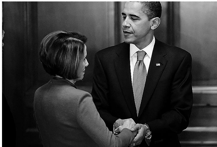
Le président Barack Obama et la présidente de la Chambre des représentants, Nancy Pelosi, photographiés juste avant que les représentants ne votent, samedi soir, le projet de réforme du système de santé.

R Le Sénat doit procéder à un vote sur son propre texte de loi. Ce vote sera précédé d'un débat qui ne commencera pas avant la publication de l'estimation du coût du plan du Sénat par le Bureau du budget du Congrès, estimation qu'on devrait connaître plus tard cette semaine. Les règles du Sénat font en sorte qu'il sera beaucoup plus difficile pour les