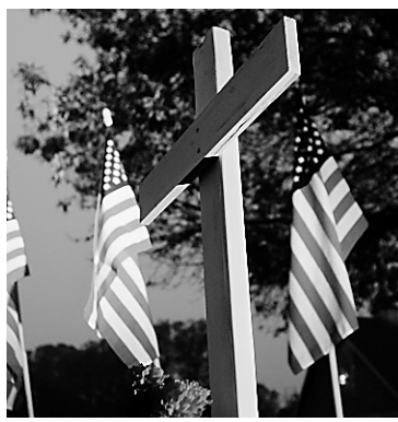
PHOTO REUTERS Une cérémonie à la mémoire des victimes du tueur fou de la base de Fort Hood a été tenue hier à la Central Christian Church.

Nidal Malik Hasan, le militaire musulman soupçonné d'avoir ouvert le feu sur des soldats à la base américaine de Fort Hood, pourrait avoir eu des liens avec un imam qui soutient Al-Qaeda. En 2001, Hasan fréquentait la mosquée Dar al-Hijrah, de Falls Church, dans la banlieue de Washington, en même temps que cet imam, Anwar al-Aulaqui. La nature précise des rapports entre les deux hommes n'est toutefois pas évidente. — AFP