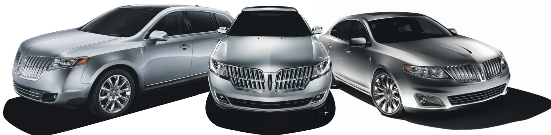
DÉCOUVREZ LE TOUT NOUVEAU LINCOLN MKT 2010