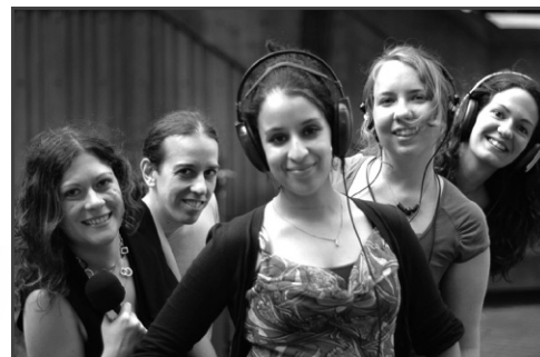
UNIVERSITÉ DU QUÉBEC À MONTRÉAL

Fort des nombreux succès, le comité Avion Cargo représente un exemple de détermination et d'innovation et contribue au maintien de la réputation d'excellence de l'École Polytechnique. Au fil des ans, le groupe, composé d'une douzaine d'étudiants issus des différents départements de génie, conçoit et fabrique un avion cargo, modèle réduit télécommandé, devant être le plus léger possible et pouvant transporter la charge la plus élevée. Puis les étudiants soumettent leur prototype aux prestigieuses compétitions annuelles Aero Design de la Society of Automotive Engineering qui regroupent des étudiants de partout dans le monde. Au cours des 12 dernières années, le groupe a grimpé sur une des trois marches du podium à chaque compétition et a même connu un doublé d'or en 2008. Occasion unique d'appliquer leurs connaissances et savoir-faire dans un contexte compétitif, le groupe Avion Cargo est extrêmement formateur pour les étudiants, confrontés aux défis du travail d'équipe et aux enjeux de société.