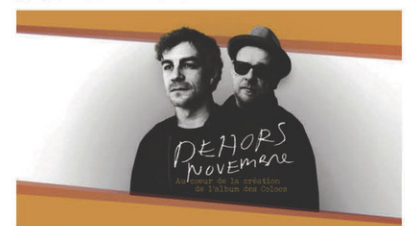
Dehors novembre // Samedi 27 avril