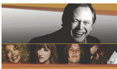
Hommage à Sylvain Lelièvre // Vendredi 9 février