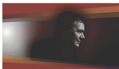
Mario Pelchat // Vendredi 5 avril