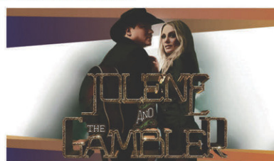
Jolene and the Gambler // Vendredi 23 février