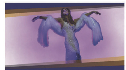
Avec le temps / Hommage à Dalida // Jeudi 8 février