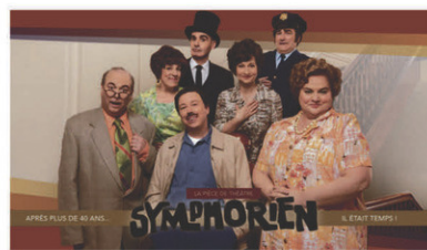
Symphorien // Samedi 3 février