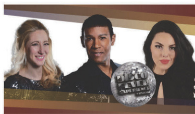
Disco Fever Experience // Jeudi 18 janvier