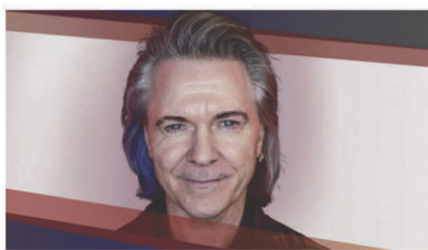
Gowan // Jeudi 23 novembre