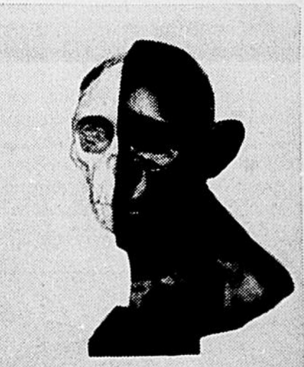
Une découverte très récente (1958), faite en Afrique, fait remonter l'origine des hominidés au tertiaire final — presque deux millions d'années. La photo ci-dessus est une reconstitution de l'Australopithecus. Il faut attendre encore environ 1 million et demi d'années avant de retrouver des traces de l'espèce homo sapiens, à laquelle appartient l'homme actuel.