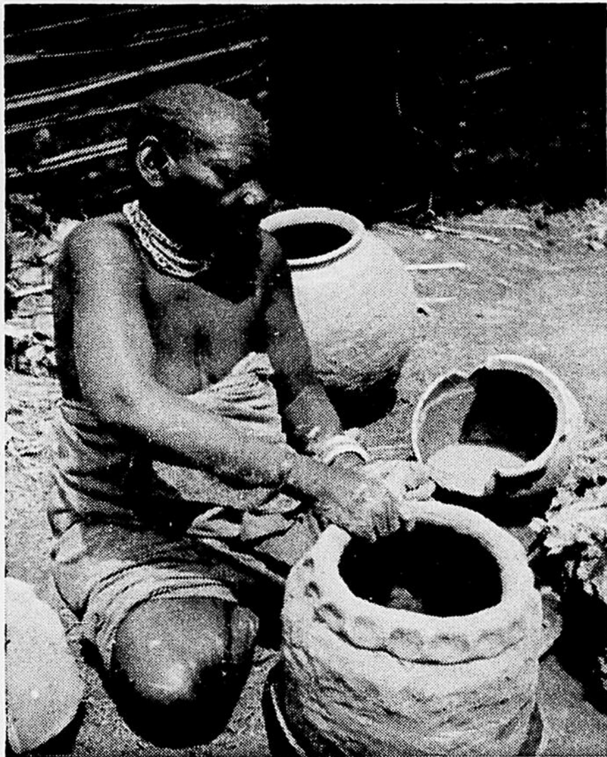
L'anthropologue s'intéresse à tous les aspects de la culture qu'il étudie. La technologie est un domaine d'une grande richesse. Ici, une femme Twa, originaire d'une caste inférieure, fabrique une cruche d'argile. Au Ruanda-Urundi, la plupart des femmes ont la tête rasée.

Les grandes disciplines anthropologiques présentées au cours de cette semaine, à savoir, l'archéologie, l'anthropologie physique, l'ethnologie et l'ethnolinguistique, gravitent autour d'un grand thème commun: connaître l'Homme à partir de ses variations physiques et culturelles dans le temps et dans l'espace. Voilà pourquoi la fonction de l'anthropologue doit nécessairement inclure un apprentissage relativement poussé de chacun de ces domaines.