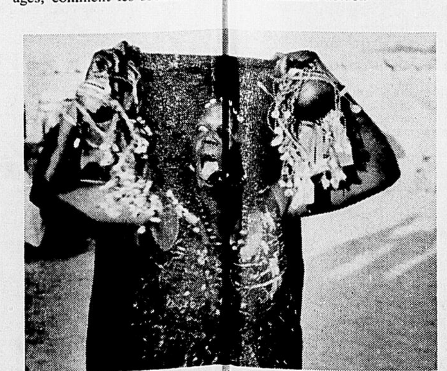
Femme djerman en proie à une possession au cours d'une cérémonie d'initiation (Photo tirée du dernier film de Claude Jutra: "Le Niger, jeune République").

Plus que jamais nous avons besoin de tenir compte de la dignité de l'homme; il faut détruire les vieux préjugés, si bien ancrés en nous, qui trouvaient leur fondement dans l'ignorance. Par une connaissance nouvelle il faut s'affermir. L'anthropologie vise à un humanisme actuel.