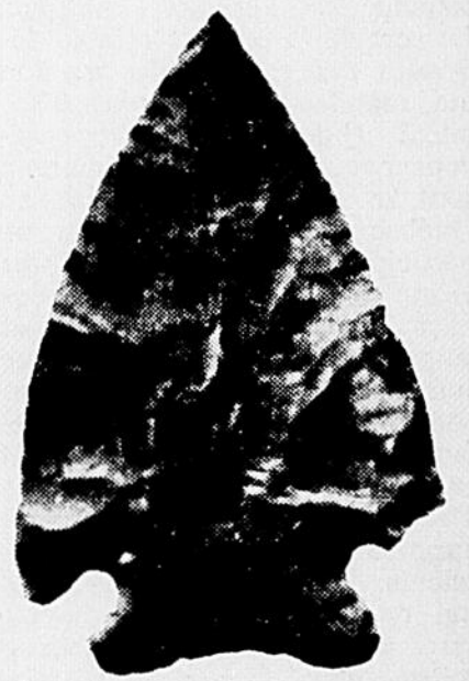
Il est possible de retracer l'histoire de l'homme avant l'écriture grâce aux matériaux qui, la plupart du temps, sont enfouis sous terre. Cette pointe de flèche appartenait aux indiens Hopewell, de la région américaine des Grands-Lacs.