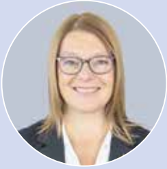
Nancy Blanchet Mairesse - Mayor