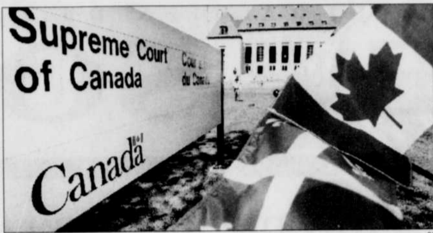
La décision de la Cour devrait ranimer la guerre des drapeaux.

Non seulement Ottawa a-t-il soulevé l'ire des souverainistes en décidant de poursuivre devant les tribunaux la bataille référendaire qu'il a presque perdue en 1995, il s'est aussi mis à dos des fédéralistes, dont les libéraux provinciaux au Québec de même que les conservateurs qui étaient dirigés à l'époque par Jean Charest.