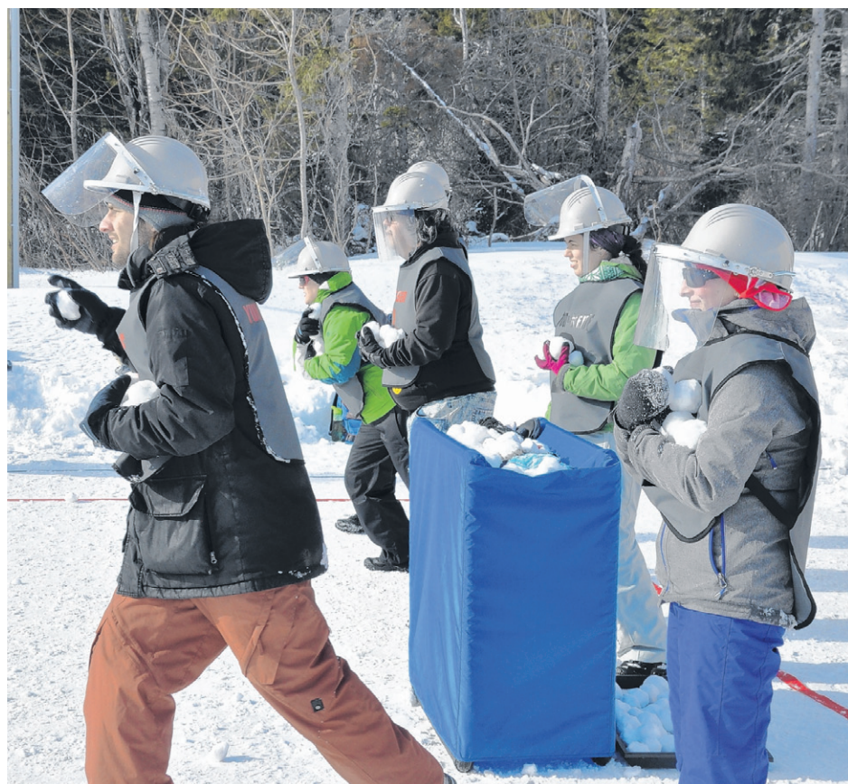
Trois équipes étaient en compétition pour ce premier tournoi de yukigassen, près du Géoparc à Percé, samedi dernier.

Comme ce sport peut être pratiqué été comme hiver, le terrain de yukigassen sera relocalisé près du camping de Percé au début de l'été. En saison estivale, les gens pourront jouer non pas avec des balles de neige... mais avec des balles de plastique.