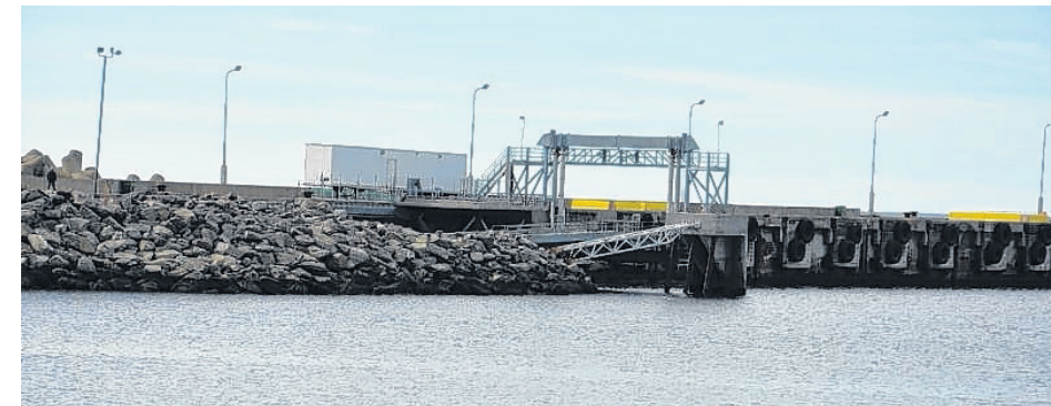
Le quai de Chandler pourrait reprendre de la vigueur au cours des prochaines années avec la présence de Ciment McInnis dans le décor...

différents marchés au Canada et aux États-Unis. Maintenant, l'entreprise songe sérieusement à utiliser le port de Chandler.