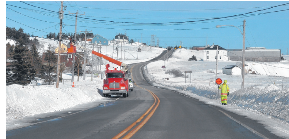
Plusieurs travailleurs et monteurs de lignes sont au travail dans tous les secteurs de la Ville de Percé.

Madame Beaulieu explique que la fibre optique est déjà présente à Percé. « La fibre optique se rend jusqu'au « quartier » et chacune des résidences était desservie par un fil de cuivre. Maintenant, ces maisons seront connectées avec de la fibre optique (et non pas un fil de cuivre). Cela signifie qu'au chapitre des services comme Internet et Télé-Optik, il n'y a pas de différence. Mais les gens verront la différence au niveau de la vitesse. Nous allons offrir des plans qui iront jusqu'à 250 mégabits par seconde pour le téléchargement,