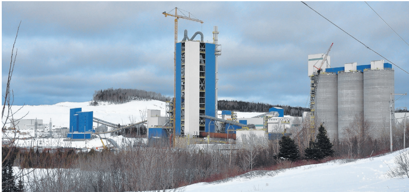
Les retombées économiques autour de Ciment McInnis pourraient être très importantes au cours des prochaines années.

Avec une cimenterie qui s'installe graduellement