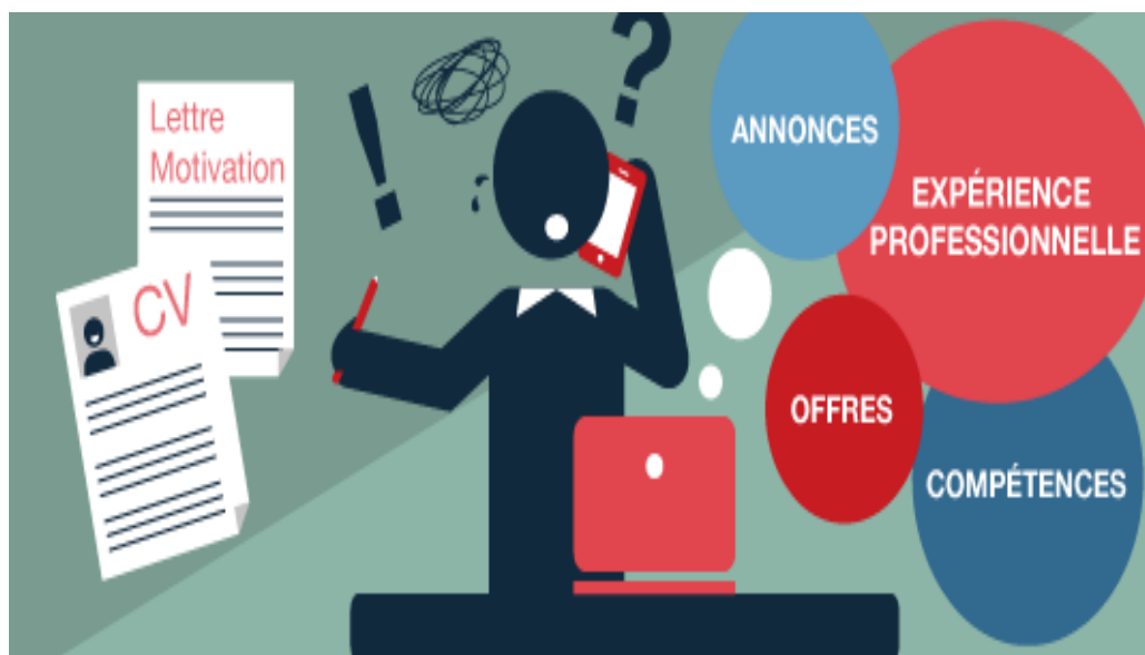
Illustration : site internet gratuit