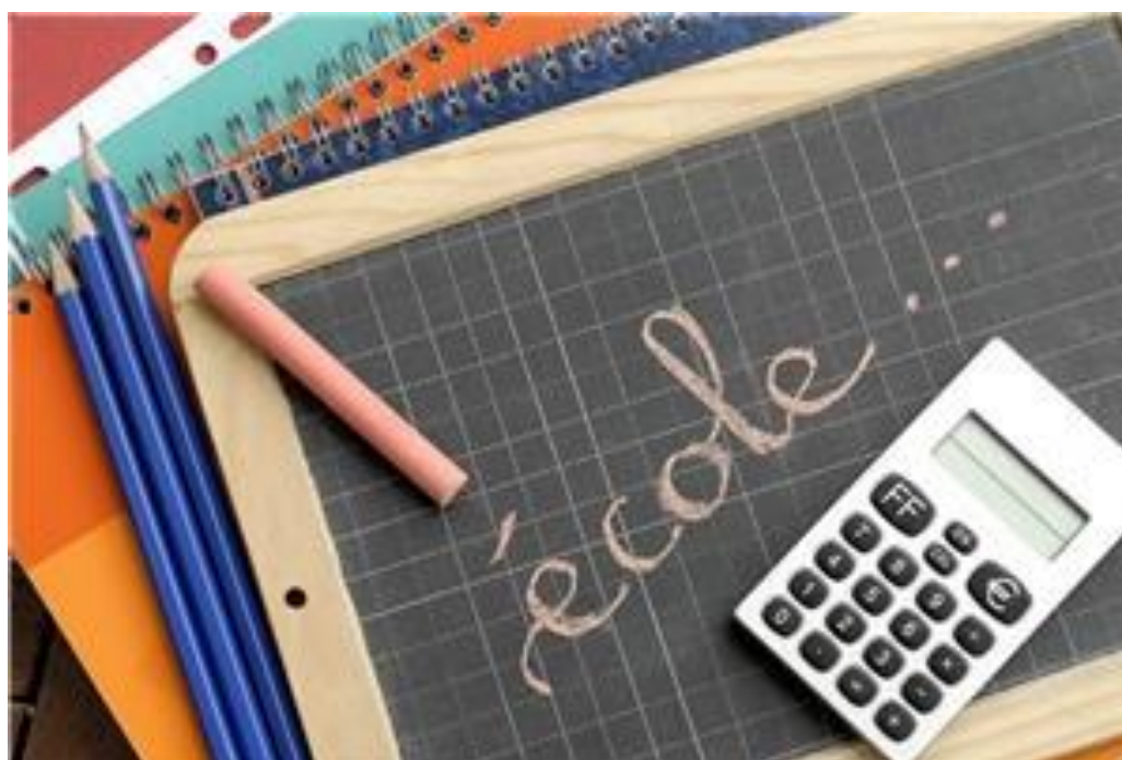
Illustration : site internet gratuit