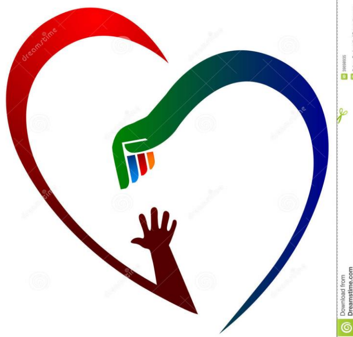
Illustration : site internet gratuit