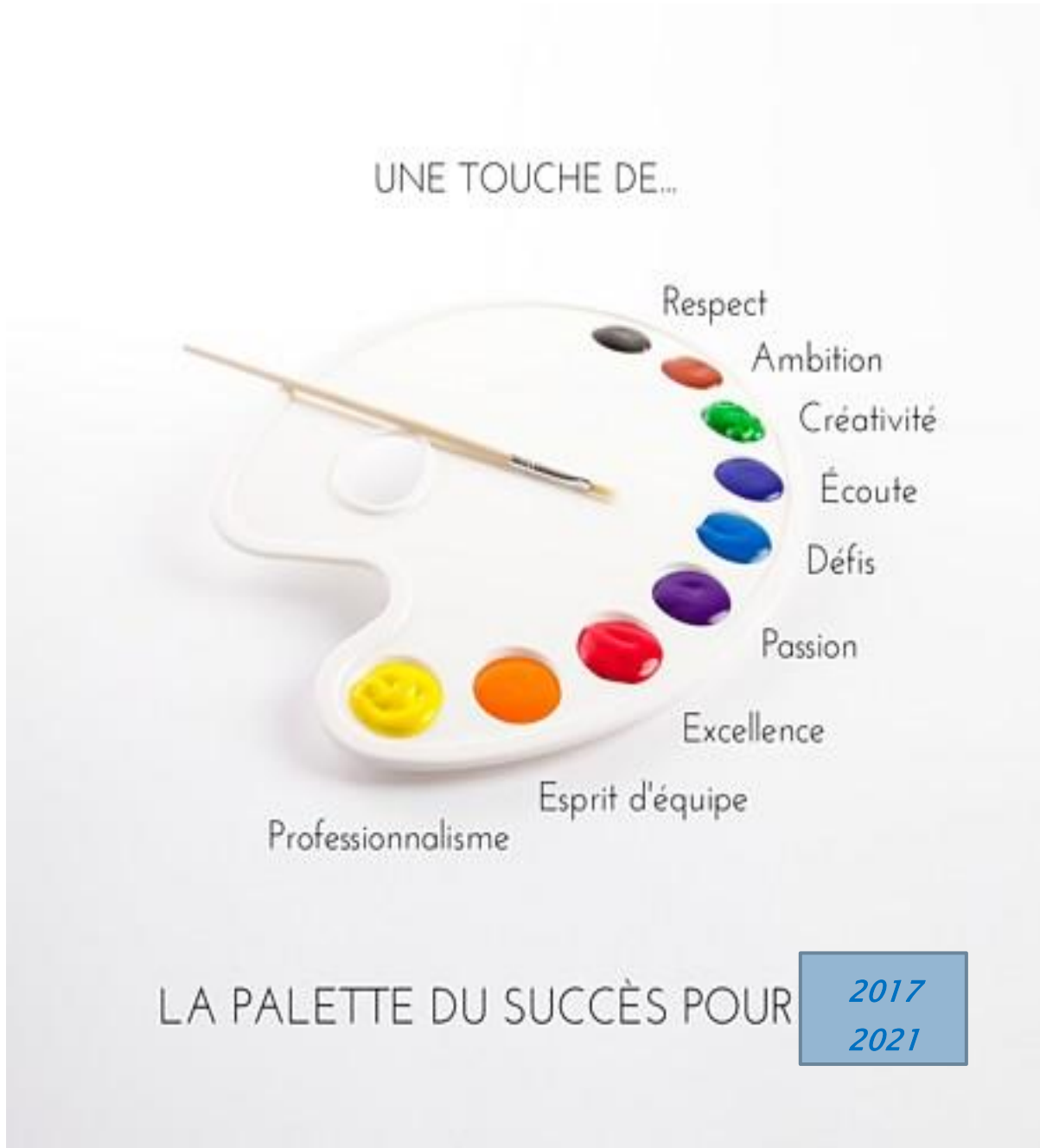
Illustration : site internet gratuit