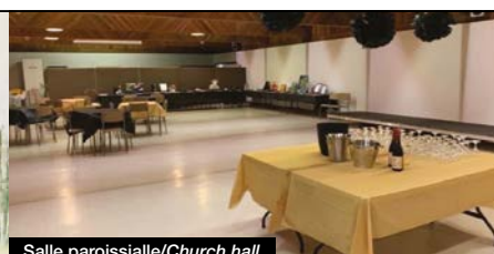
Salle paroissiale/Church hall

Notre salle paroissiale se prête à toutes sortes de réunions de famille, de conférences, de jeux sociaux et autres. Elle est rattachée à une cuisine entièrement équipée qui permet de servir des repas chauds. Située au rez-de-chaussée, elle est accessible aux personnes handicapées. Pour plus d'informations, veuillez nous contacter au staugustinerentals@bellnet.ca ou nous laisser un message au 450 653-4402