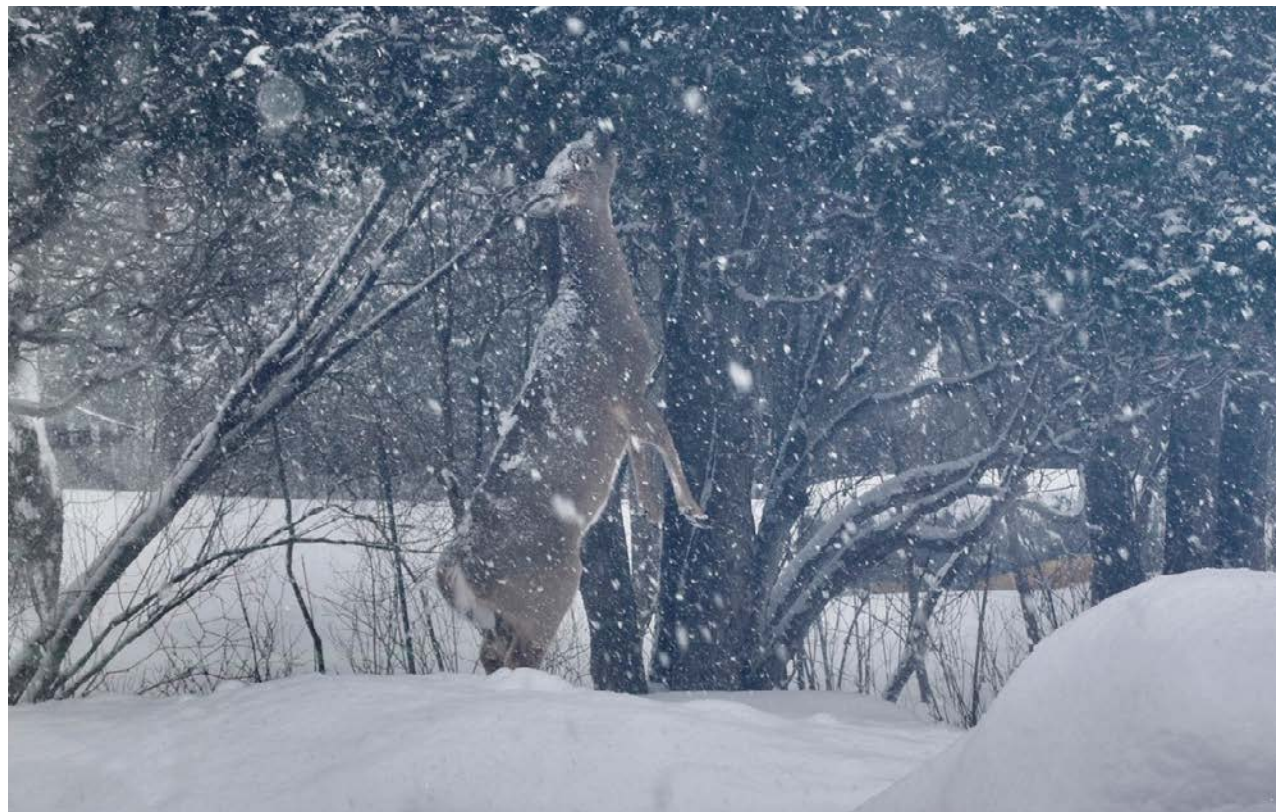
Les cerfs s'attaquent aux arbres et arbustes des citoyens.

Les cerfs de Virginie sont encore nombreux à prendre d'assaut la cour arrière des citoyens de Saint-Bruno-de-Montarville, et ce, malgré l'intervention de la Sépaq en décembre dernier.