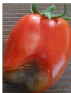
Cul noir tomate.

Après avoir approfondi la question afin d'y voir un peu plus clair, je vous énumère les principales causes : l'arrosage, l'excès d'azote, les champignons et les virus.