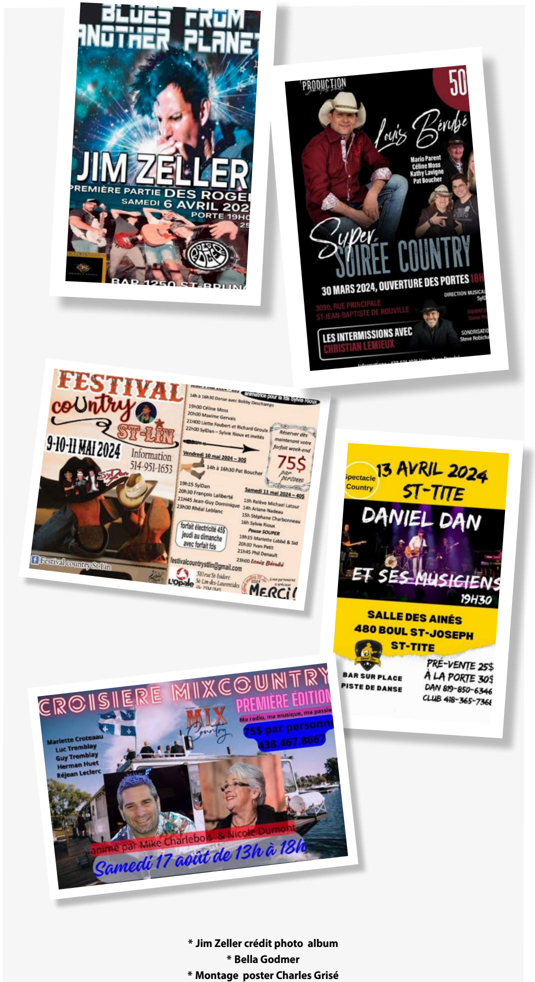
* Jim Zeller crédit photo album * Bella Godmer * Montage poster Charles Grisé

Ne manquez pas, le lundi soir sur mixcountry.ca, mon émission Kick Country, diffusée de 19 h à 21 h. En plus de la bonne musique, je vous parle aussi des événements à venir. Alors, c'est un rendez-vous pour les amateurs de musique country. D'ici le prochain lundi, n'oubliez surtout pas que la vie est... SIMPLEMENT COUNTRY!