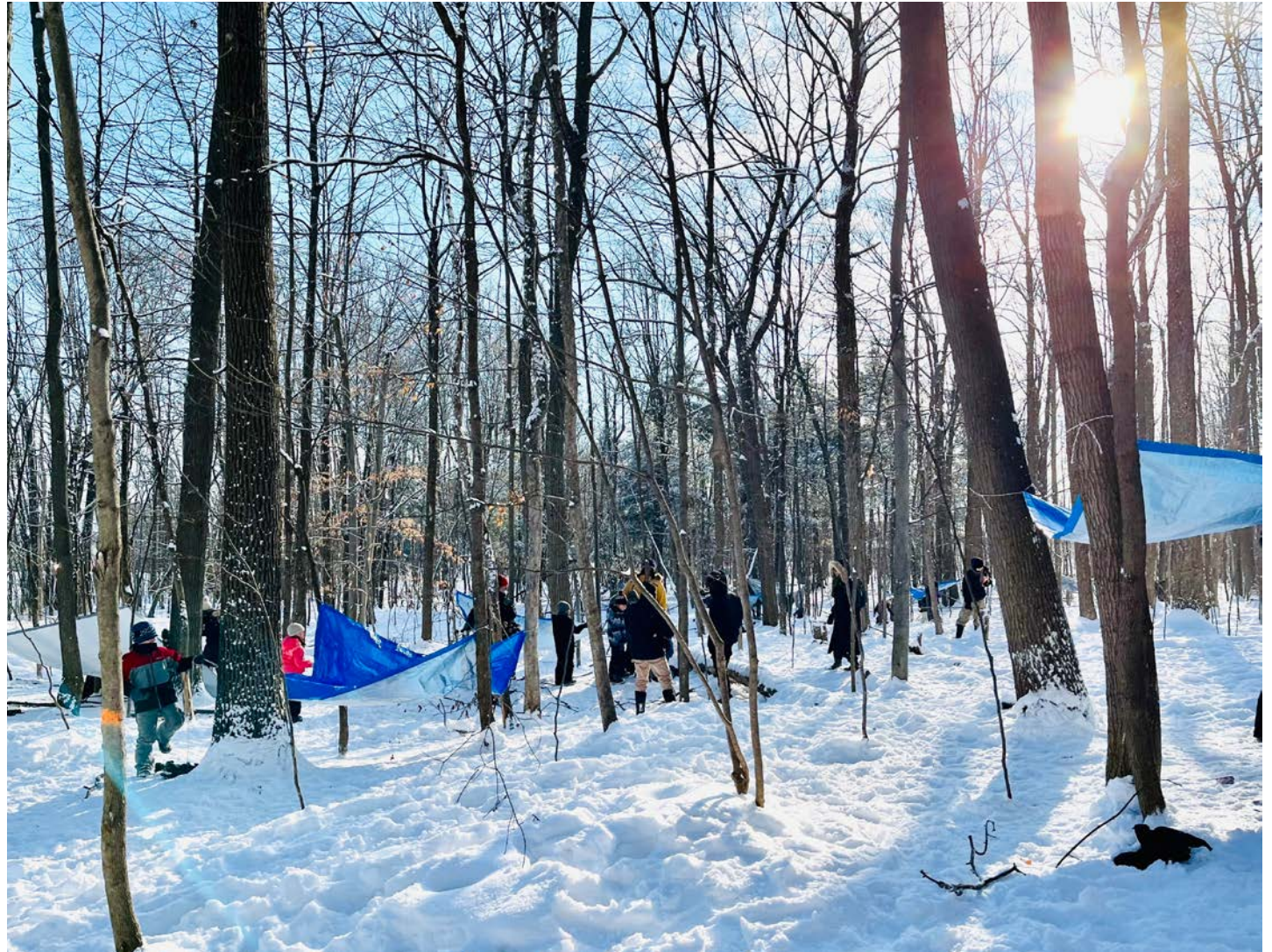
L'Académie des Sacrés-Coeurs développe des classes nature pour le bien-être des élèves et des enseignants.

En ce qui a trait à la discipline et à la gestion du temps, les enseignantes n'ont que du positif à dire. « De retour en classe, les élèves sont détendus et concentrés », affirme