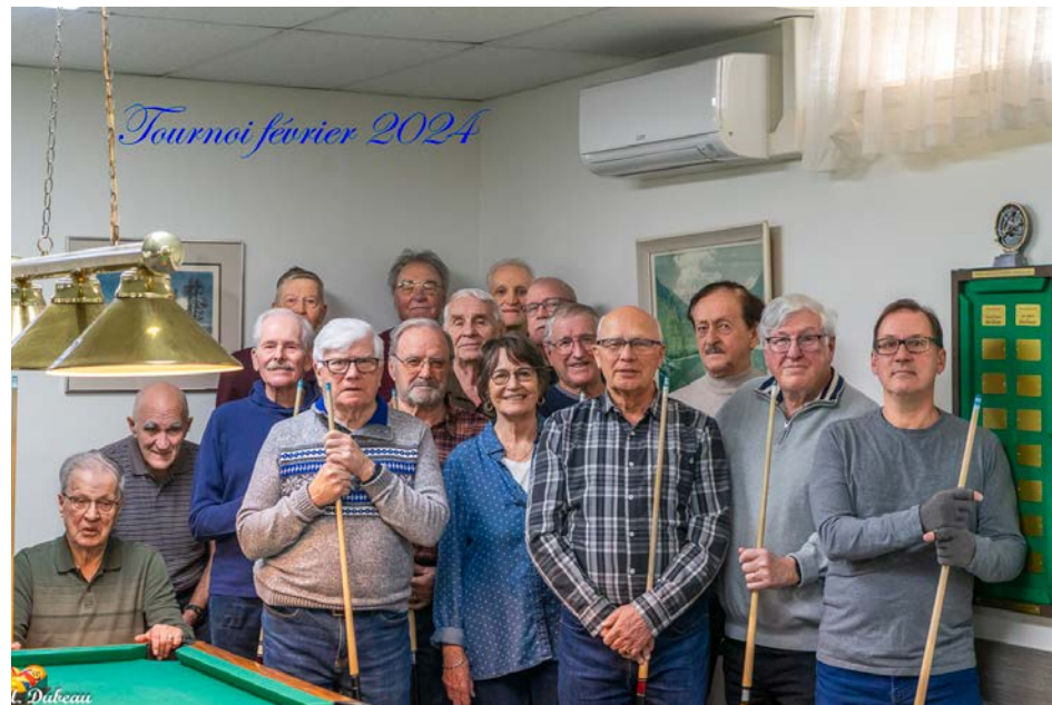
Un tournoi amical de billard a eu lieu au Club de l'âge d'or de Saint-Bruno

Cette activité fait partie de l'offre de services du Club de l'âge d'or de Saint-Bruno