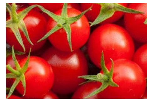
cerise tomate Tiny Tim

e) Au paillage des plants de tomates, évitez les végétaux produisant un excès d'azote, par exemple, résidus de gazon;