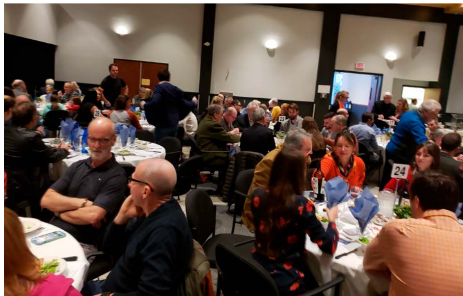
Le souper bénéfice a eu lieu au Centre Marcel-Dulude.

Le Club Richelieu appuie notamment Le Centre d'animation mère-enfant (CAME), la Coopérative d'habitation de Saint-Bruno, le CLSC de Saint-Bruno, le Défi cycliste d'IGA, les Amis-Soleil, le Centre d'action bénévole Les p'tits bonheurs, etc.