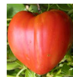
Tomate cœur de bœuf

La recherche n'a pas encore trouvé de produit pour éradiquer ce virus. Ce n'est pas comme un champignon que l'on peut contrôler. Quand un plant est contaminé, il faut vraiment le détruire. Il faut ensuite faire une décontamination complète des installations.