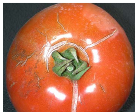
Fendillement tomate

Ce phénomène est un problème et non pas une maladie. Les fentes peuvent être circulaires ou longitudinales. Les causes les plus fréquentes de fissures chez les tomates sont multiples. En voici quelques-unes : a) La tomate qui est laissée sur le plant pendant une trop longue période devient trop mûre. Alors, sa peau plus mince devient fragile et moins élastique, et est plus susceptible de se fendiller; b) Les fluctuations de la quantité et de la température de l'eau reçue forment une autre cause; c) Un excès d'azote l'est également; d) Les changements brusques de température peuvent aussi être une cause.