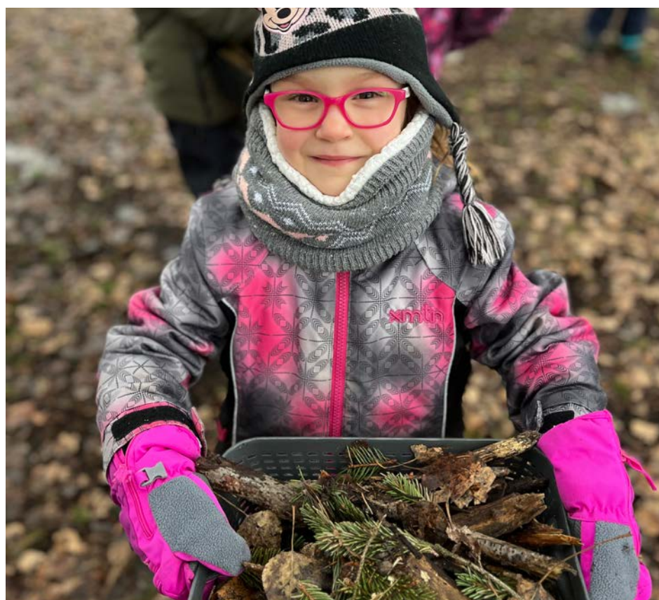
Les enseignantes adaptent leurs méthodes pour enseigner les mêmes matières que les classes régulières.