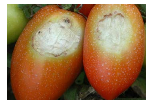
Virus du fruit rugueux tomate

Ce virus, hautement contagieux, cause d'importantes pertes chez la tomate de serre. Le fruit rugueux de la tomate a été observé en Ontario il y a quelques années. Il a depuis fait son entrée dans les serres du Québec. Le ToBRFV fait craindre le pire aux producteurs, car il peut décimer des récoltes entières.