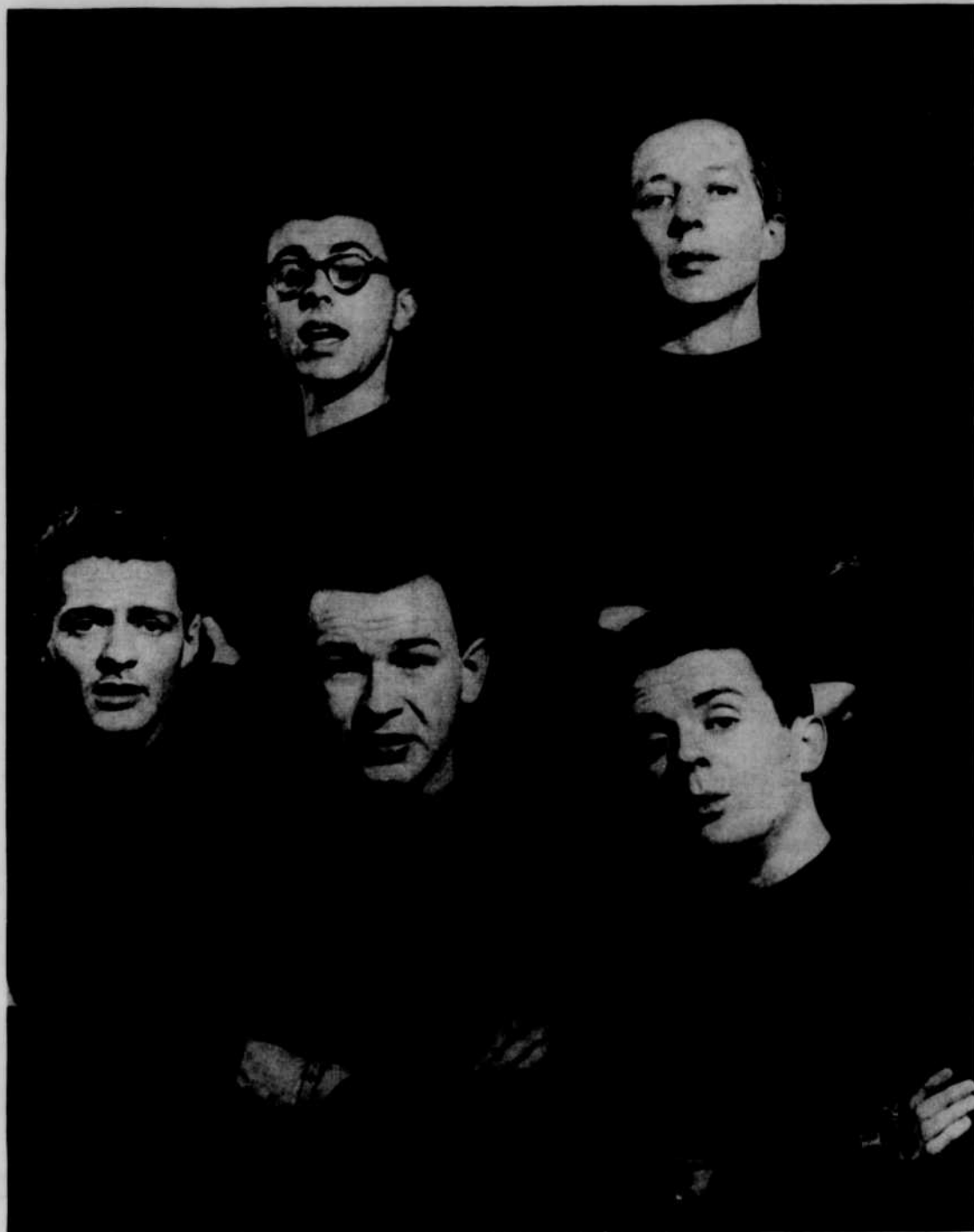
Cinq étudiants forment l'ensemble des "Gamins de la gamme"