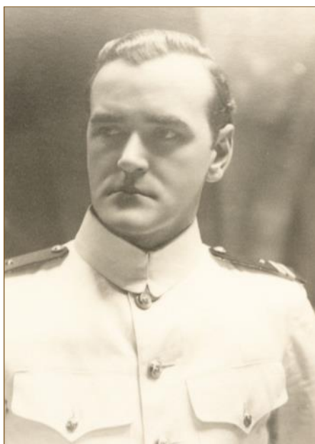
Raoul Jobin, en 1935

M. Jobin a remporté l'un de ses plus beaux succès depuis son retour à