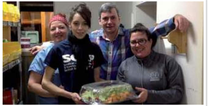
Équipe des services alimentaires du Centre de santé de Chibougamau