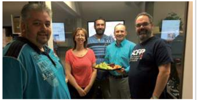
Équipe régionale du technocentre