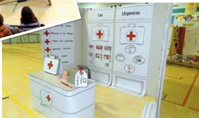
Les urgences dentaires de la clinique