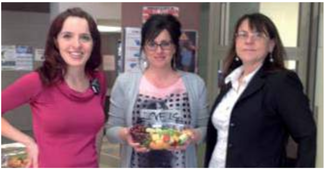
Équipe de l'accueil du Centre de santé de Chibougamau