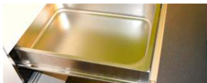
Tiroir amovible en acier inoxydable