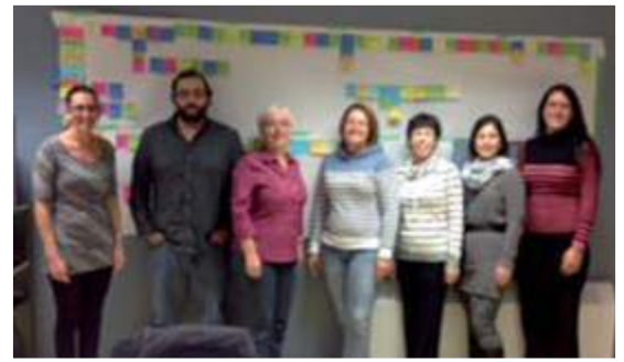
Équipe Kaizen du CS Isle-Dieu

Merci à tous ceux et celles qui ont participé au succès de ces projets. ♦