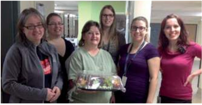
Équipe des archives du Centre de santé de Chibougamau