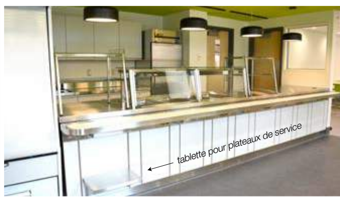
Comptoir de service