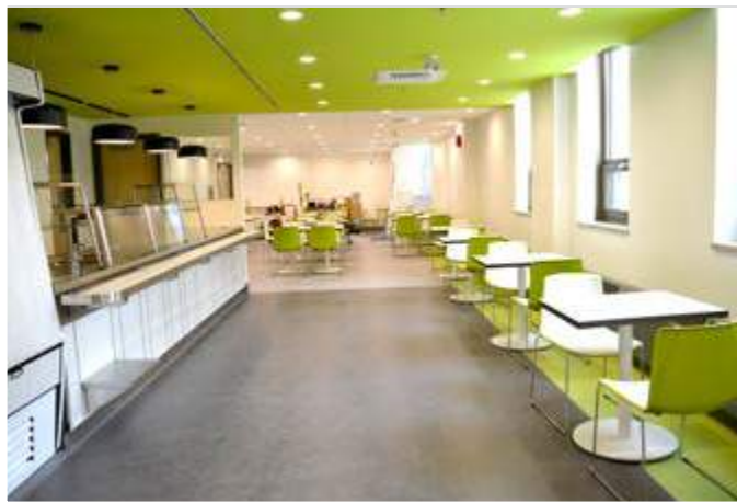
Vue d'ensemble de la cafétéria (52 places)

Article à venir dans le prochain numéro.