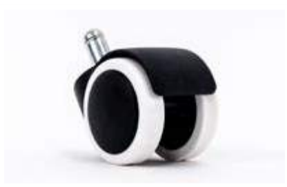
Roue pour plancher lisse