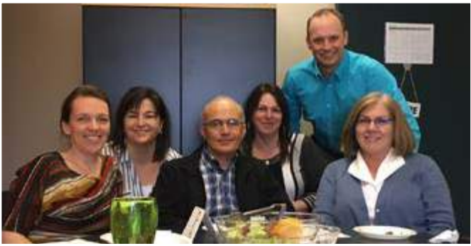
Équipe de la direction de la qualité, des risques et des ressources informationnelles