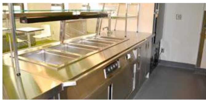
Service - Table chaude