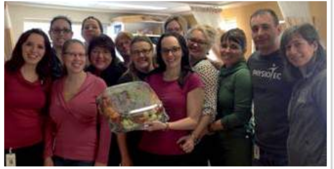
Équipe du service de réadaptation du Centre de santé de Chibougamau