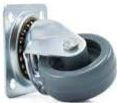
Roue pour tapis

Si le plancher est lisse, les roues doivent être en polyuréthane