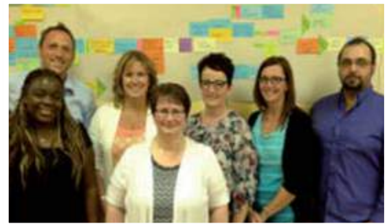
Équipe Kaizen du CS Lebel