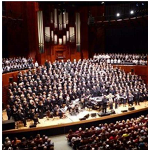
Le Grand chœur Félix-Leclerc Juin 2014 au Palais Montcalm