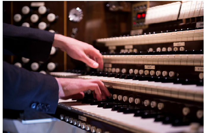
Le Choeur St.Andrew & St.Paul