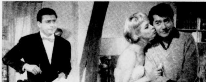
Jeudi à 2 heures, "Réveille-toi, chérie".