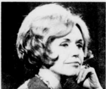
"Aujourd'hui", tous les soirs à 7 heures.