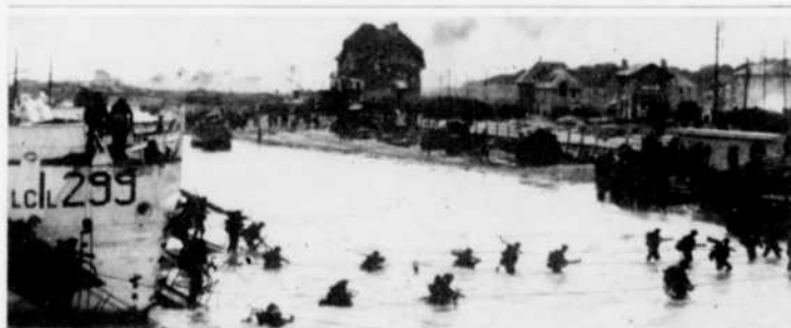
"Le Canada en guerre", dimanche à 5 heures.