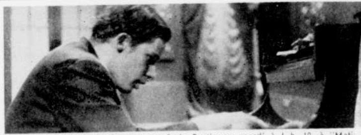
Glenn Gould jouera le Concerto no 2 de Beethoven, mardi à 1 h. 10, à "Musique symphonique".