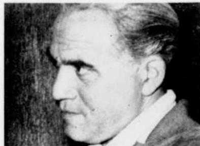
Lorne Greene, en "Aventurier des mers".