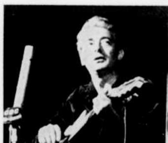
Félix Leclerc, à "Mon pays, mes chansons", lundi à 8 heures.