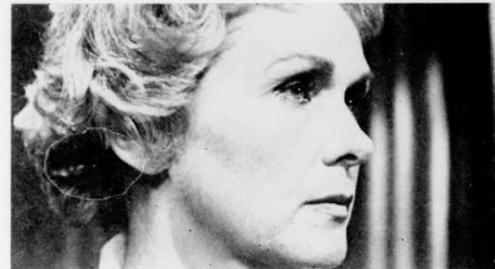
Elizabeth Schwarzkopf chantera des lieder de Richard Strauss, mardi à 3 heures, aux "Chefs-d'oeuvre de la musique".