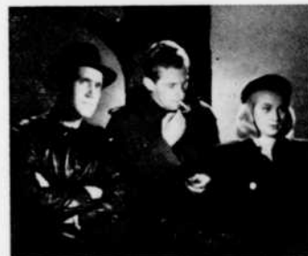
« Musique dans les ténèbres »