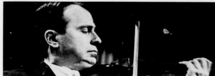
Henryk Szeryng est le soliste de la "Symphonie espagnole" de Lalo, dimanche matin à 8 h. 30.