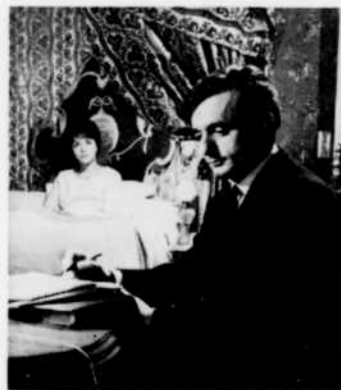
Un "coup dur" sera porté au "Bonheur conjugal", mercredi à 9 h. 30.

"Alina" ou la Fille de la nuit", drame passionnel de Giorgio Pastina, avec Gina Lollobrigida et Amedeo Nazzari. La jeune épouse d'un vieux contrebandier prend, à la mort de son mari, la tête d'une bande de fraudeurs.