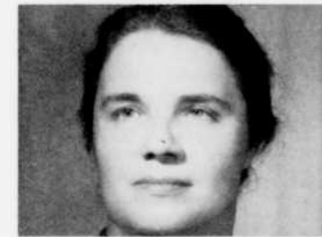
A "Concert", samedi à 8 heures, la pianiste Tatiana Nikolayeva.