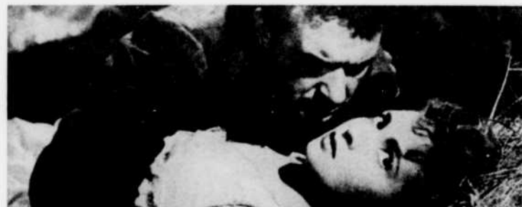
Mercredi soir à 11 heures, "Alina", mettant en vedette Gina Lollobrigida et Amedeo Nazzari.