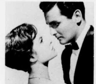
"La Toile d'araignée", à minuit.