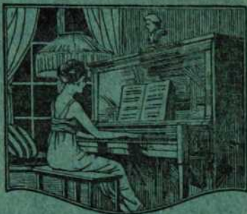
PIANO D'ARTISTE DES CANADIENS-FRANCAIS

Ce magnifique produit de l'industrie canadienne-française est fabriqué en vue de résister au climat canadien. C'est un instrument artistique dans toute l'acception du mot. Il est un des rares pianos qu'on puisse acheter par correspondance, car il possède toutes les perfectionnements artistiques désirables, et il est toujours uniforme.