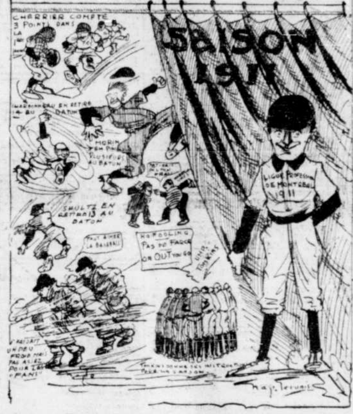
L'ouverture de la saison de la Ligue Montréal Professionnelle, hier après-midi, au Parc Delorimier. --- Impression de l'artiste de la "Presse".

Newark 24. --- Jouant un jeu d'une qualité supérieure et délaissant leurs adversaires du commencement à la fin, les Royals ont terminé leur première série de quatre victoires par une victoire de 4 à 1 sur les Athletics de Newark. Le score de 4 à 1, devant une foule de 1,500 personnes.