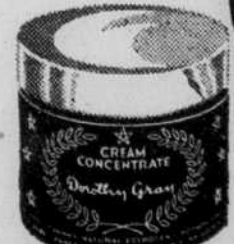
Drs. rec. par Dorothy Gray (Canada) Ltd.

... même si vous avez passé la trentaine, vous concourez à conserver à votre peau cette fraîcheur et cet aspect de jeunesse en faisant usage de la fameuse préparation Cream Concentrate de Dorothy Gray. Cette crème du soir, riche et lubrifiante, contient un effectif ingrédient "hormone" que la peau absorbe aisément. Faites-en une application régulière... et bientôt votre peau aura une apparence plus radieuse, plus douce, plus jeune. 2 oz. $5.00