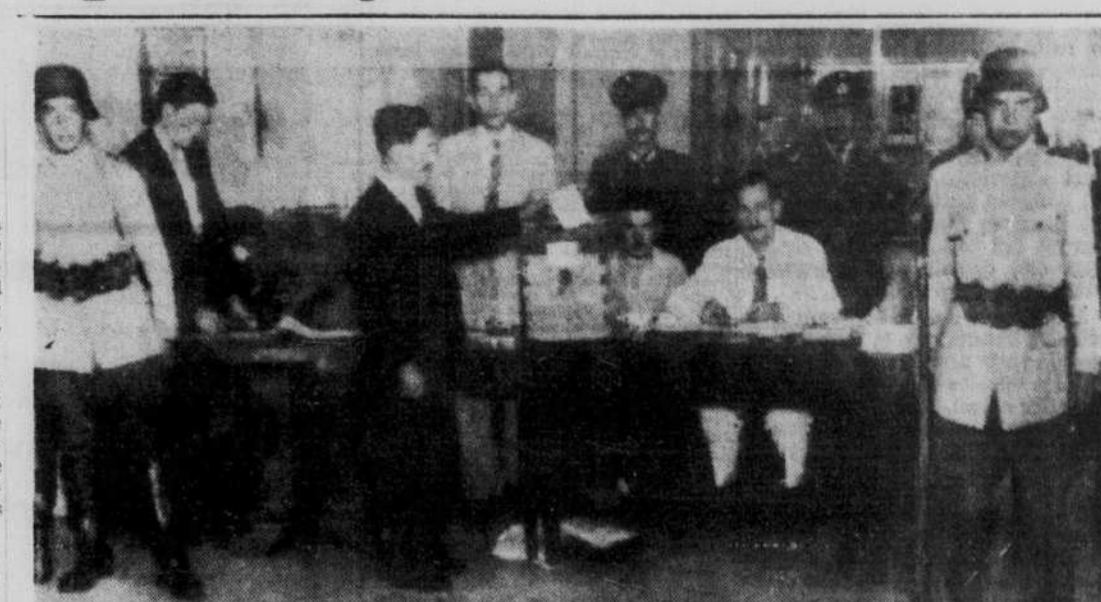
LE VOTE "SECRET" EN ARGENTINE : Un des 3,000,000 d'électeurs argentins dépose ici son bulletin de vote, lors des élections de dimanche dernier. Les électeurs avaient à choisir entre le colonel JUAN PERON "l'homme fort" du parti ouvrier, et le Dr JOSE TAMBORINI, candidat de l'Union démocratique. Les bureaux de votation étaient gardés par des soldats, baïonnette au canon. Les élections n'ont pas été marquées des violences que laissait prévoir la violente campagne électorale qui dura depuis deux mois.