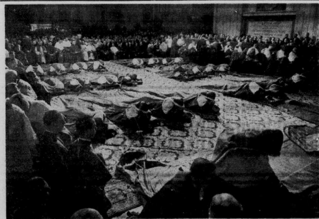
LES CARDINAUX SE PROSTERNENT : Cette photographie a été prise à Rome, lors de la plus solennelle de toutes les cérémonies qui ont marqué l'élévation à la dignité de cardinal de prélats venus de toutes les parties du monde. Les nouveaux cardinaux se prosternent ici en adoration, devant l'autel de Saint-Pierre, pendant le chant du "Te Deum". Le cardinal doyen GRANITE lut ensuite la prière rituelle "Super electos cardinales", après quoi les nouveaux cardinaux se relevèrent nantis de toutes les prérogatives de leur rang.

Toronto, 26 (P.C.) — Une récompense promise pour l'arrestation des coupables a activé aujourd'hui les recherches entreprises pour retrouver les bandits qui se sont emparés pour quelque $40,000 de fourrures dimanche dernier, à la Koretsky Wholesale Company. Les voleurs percèrent un mur de trois pieds de largeur et de dix-huit pouces de profondeur pour pénétrer dans l'entrepôt de fourrures. B. Koretsky, copropriétaire du magasin, a déclaré qu'il était demeuré toute la fin de semaine dans son appartement, situé au-dessus du magasin de la rue College, mais qu'il n'avait rien entendu. Le vol ne fut découvert que lundi matin, lors de l'ouverture du magasin. Ce vol est le deuxième vol important de fourrures commis à Toronto depuis trois mois. Des fourrures évaluées à $39,000 ont déjà été volées dans un magasin de la rue Bloor.