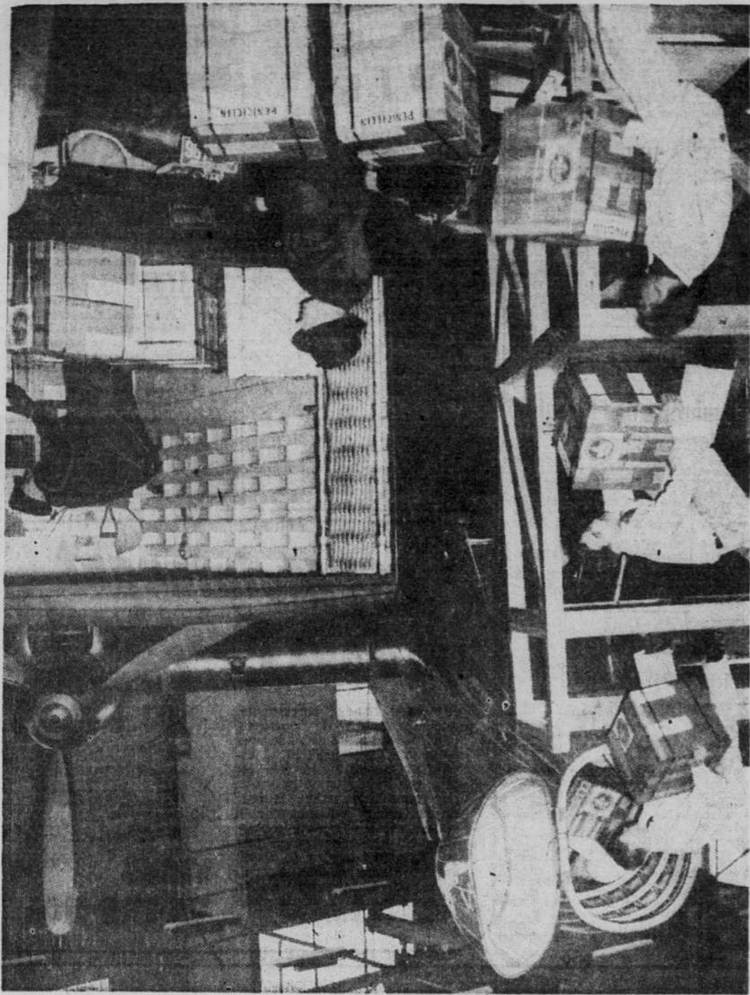
SECOURS CANADIENS A L'EUROPE : Des caisses renfermant des récipients de pénicilline sont placées ici dans le nez d'un gros avion Lancaster, à l'aéroport de Dorval. Cette pénicilline est transportée en Europe, où elle aide à soulager les populations décimées par la maladie. Les gros avions d'Air-Canada font maintenant trois envoies hebdomadaires en Europe. Ils transportent à chaque voyage huit à dix passagers et 3,500 livres de courrier et de colis postaux.