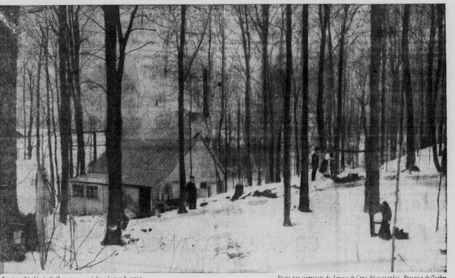
La sirop d'érable du Québec est renommé dans le monde entier.

Connaissez-vous le Québec? Savez-vous, par exemple, que plus de 60% de la production canadienne de sirop d'érable vient de notre province? La valeur de cette récolte, en 1944, s'est chiffrée à $7,335,000. Les produits de l'érable sont très recherchés pour la table, mais ils ont aussi une application très précieuse dans l'industrie du tabac où on les utilise pour conserver l'humidité et la fraîcheur des tabacs. Étant donné que 87% de tous les tabacs transformés et vendus au Canada proviennent de la province de Québec, on comprend facilement le rapport économique qui existe entre ces deux produits de chez nous.