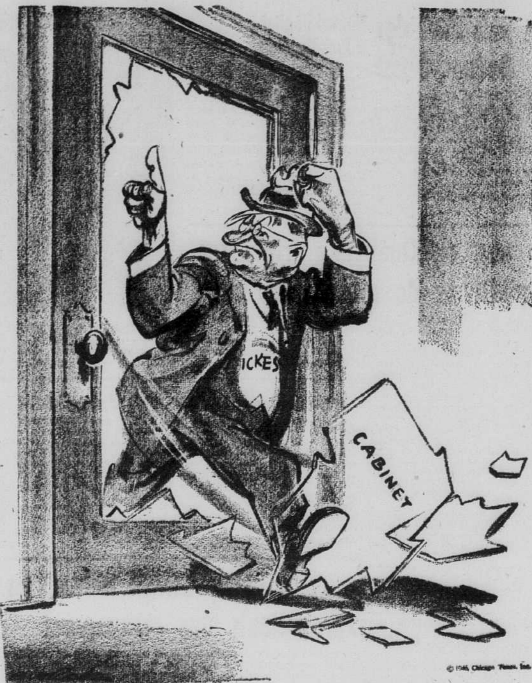
Un ministre américain qui sort en protestant.

Tout empire. Québec attend. Quel concours d'hypocrite! Tout le monde se compromet. Le marche noir est bien pourvu. Le faubourg veut que ce soit Guay. Elle compte sur des chevaux selés. La force se range du côté de la perfidie. Le Veau d'Or a des adorateurs serviles. Dame Rumeur grimpe sur le mur du silence. New-York souffre de troubles circulatoires. Un autre ministre pourrait bien sortir en cassant les vitres. Peron a la garde des boîtes du scrutin et le moyen de suspendre la constitution argentine.