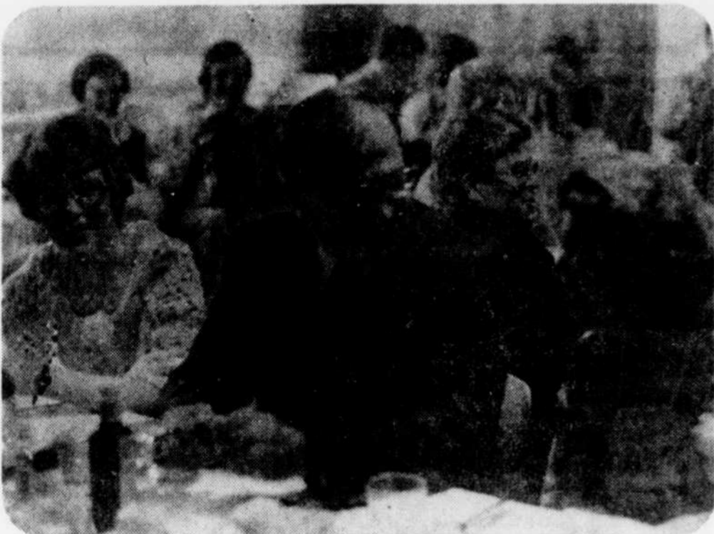
Souper mixte du Richelieu

Le carnet de commandes de la section wagons est bien rempli, pour 1976 également, puisqu'il se chiffre à plus de $50 millions pour la fabrication de 1.800 unités de différents types.