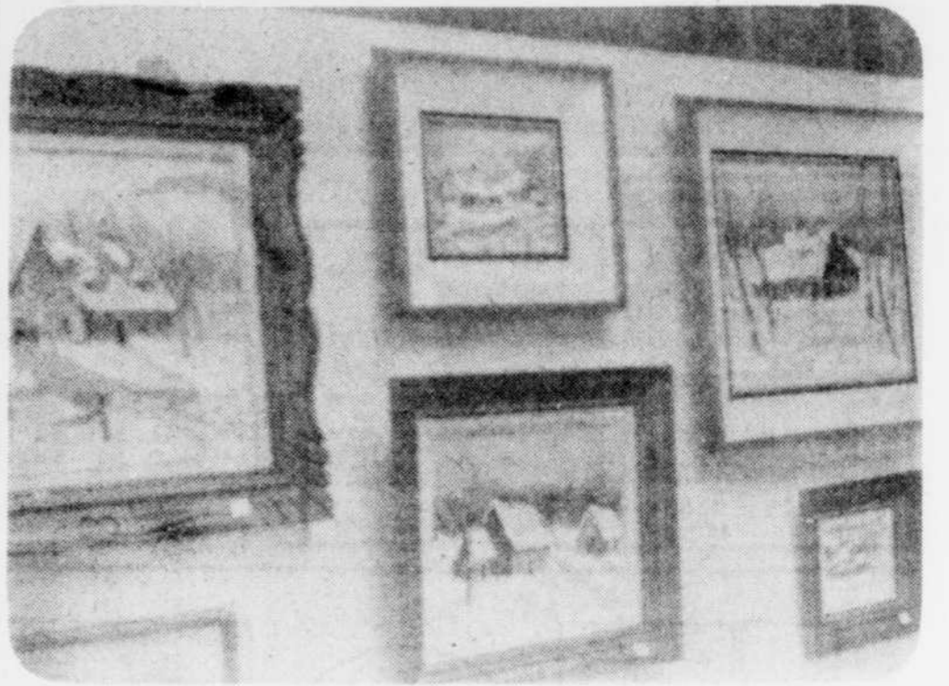
Un coin de l'exposition du comité culturel.