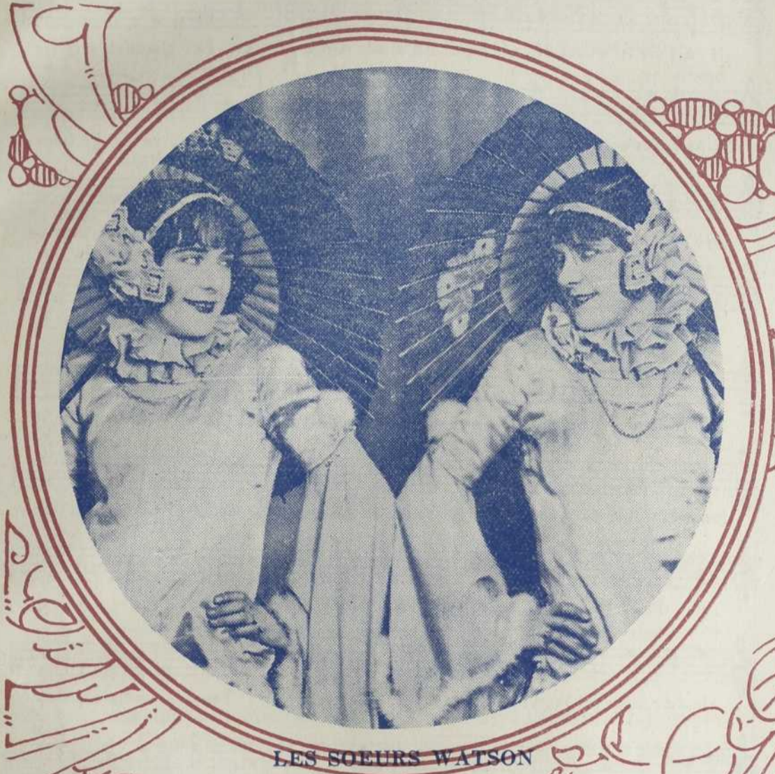
LES SOEURS WATSON