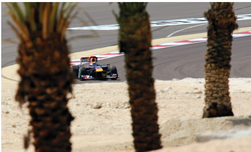
Le pilote Sebastian Vettel sur le circuit de Sakhir, à Bahreïn, l'année dernière. Le Grand Prix 2011 n'aura pas lieu en raison de la situation politique dans le pays.

«J'espère que la F1 et nos amis partout dans le monde comprendront notre décision dans ces moments difficiles», a-t-il ajouté, se disant «impatiant de recevoir les écuries, les pilotes, toutes les personnes impliquées dans la Formule 1 à nouveau à Bahreïn dans un futur très proche.»