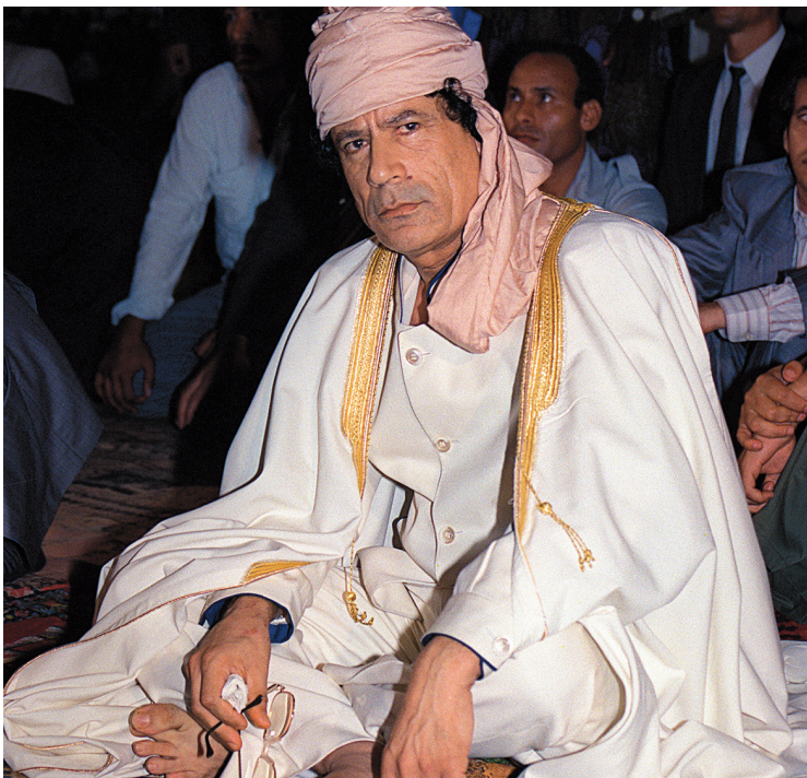
Le colonel Mouammar Kadhafi en 1989