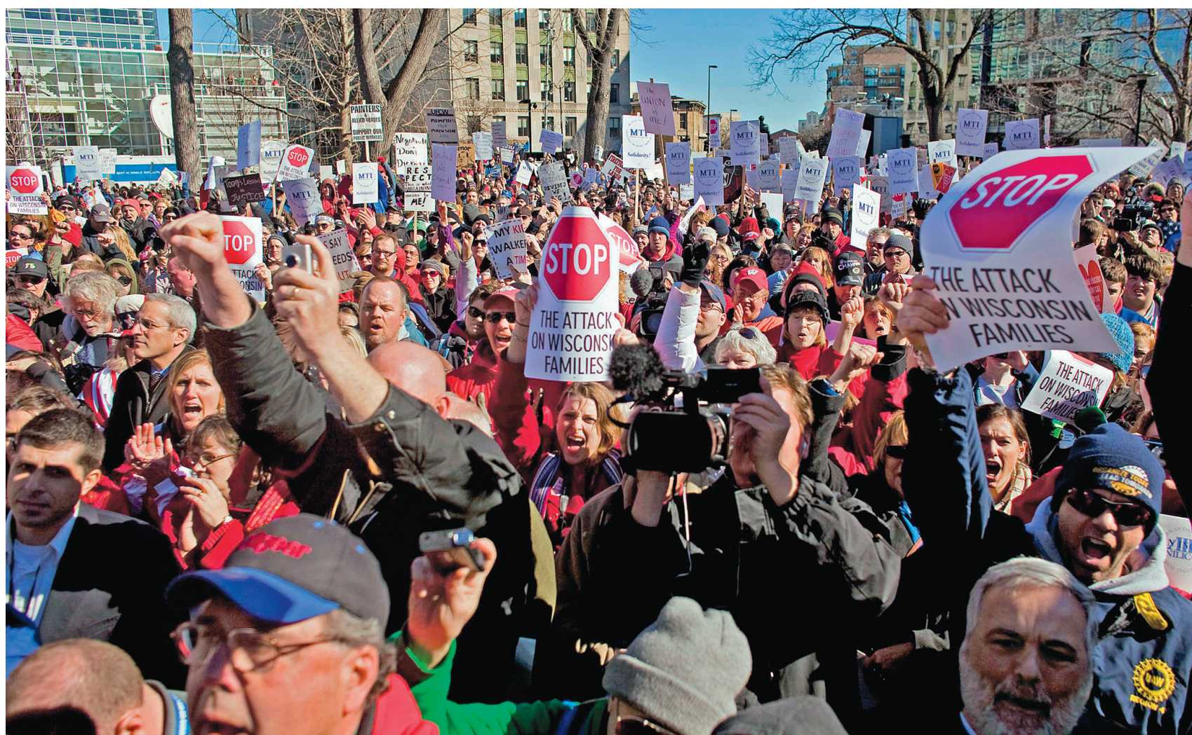
Les manifestations se multiplient depuis une semaine à Madison, au Wisconsin, le gouverneur républicain de l'État s'attaquant aux syndicats pour mener sa lutte contre les déficits publics.