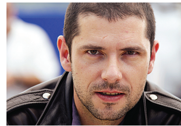
Melvil Poupaud possède comme acteur une importante feuille de route.

Le tournage commencera dès dimanche à Montréal, pour se terminer le 12 avril. Il se fera dans la région du Grand Montréal et dans celle de Charlevoix. Un second bloc de tournage débutera à la mi-septembre pour se terminer à la mi-octobre. Le