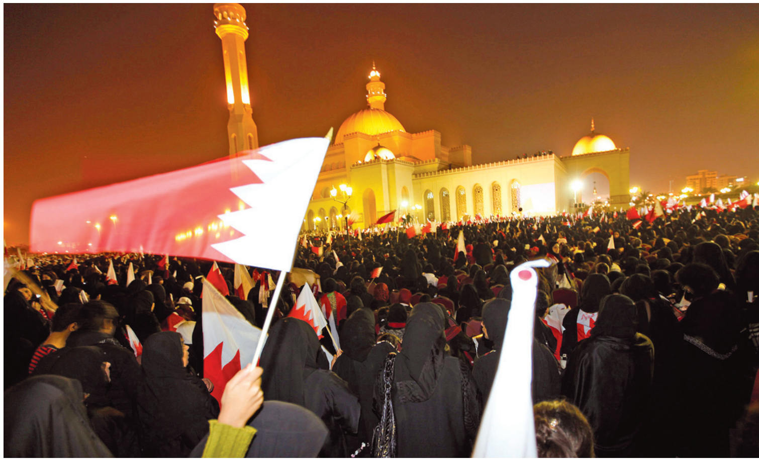
HAMAD I MOHAMMES REUTERS

Les partisans du régime en place à Bahreïn ont manifesté hier devant la grande mosquée.