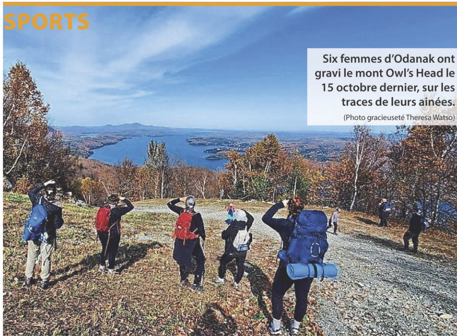
Six femmes d'Odanak ont gravi le mont Owl's Head le 15 octobre dernier, sur les traces de leurs aînées.