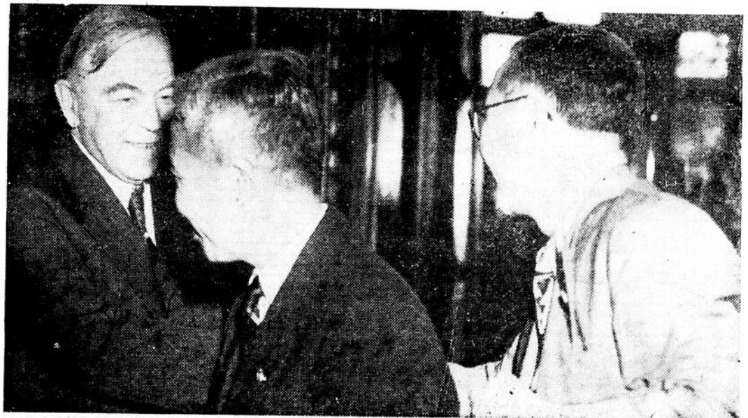
Le premier ministre King reçoit les délégués chinois venus assister à la conférence de la paix.

Le ministère de la Santé nationale et du Bien-être social engagé les femmes des soldats canadiens, récemment arrivés d'outre-mer, à écrire au ministère de la Santé de la province où elles vivent, pour se renseigner sur les divers services d'hygiène mis à leur disposition. Les femmes des soldats canadiens doivent être en mesure de préserver la santé de leur famille.