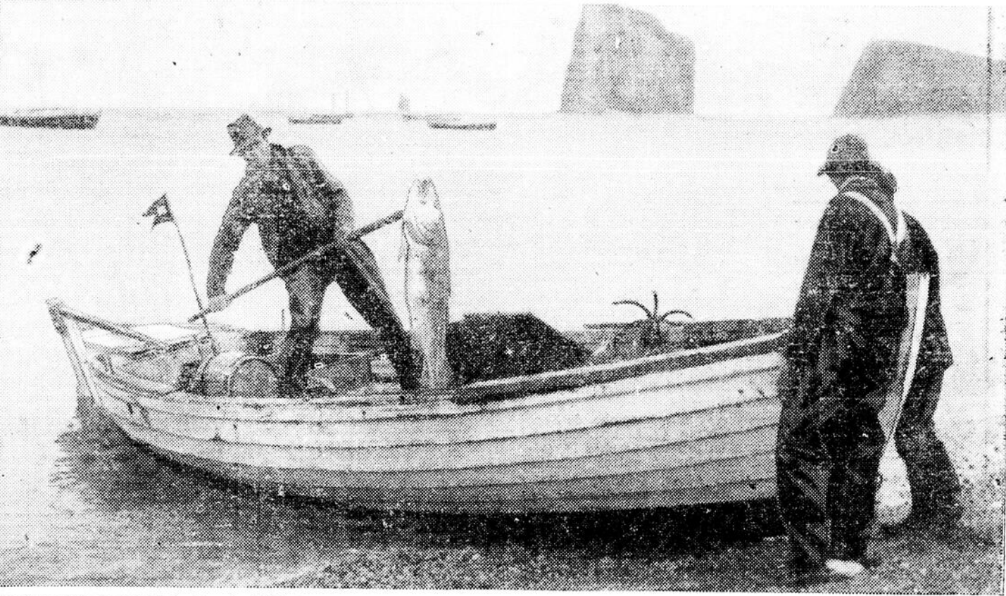
Les pêcheurs du Québec font de belles prises dans l'Atlantique