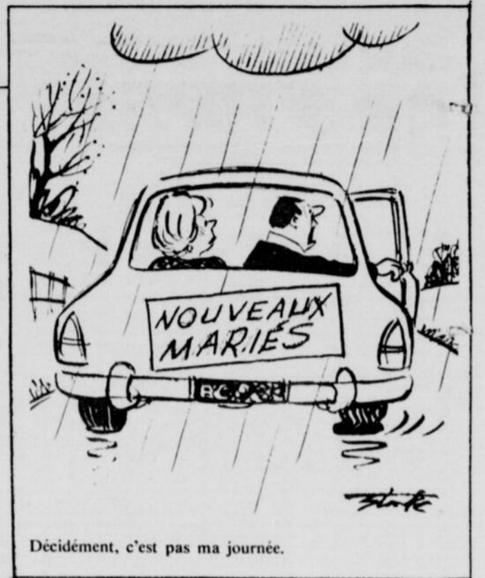
Décidément, c'est pas ma journée.