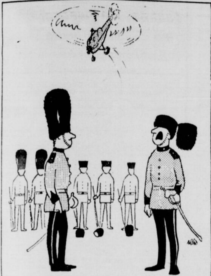
Vous trouvez pas qu'il a passé un peu trop bas?