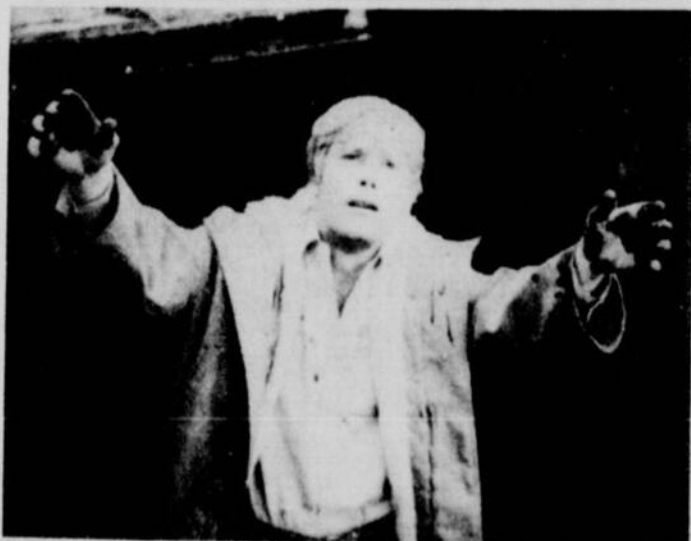
Une scène du film tant controversé du réalisateur yougoslave Dusan Makavejev, "W. R.: The Mysteries of the Organism", présentement à l'affiche du cinéma Festival.