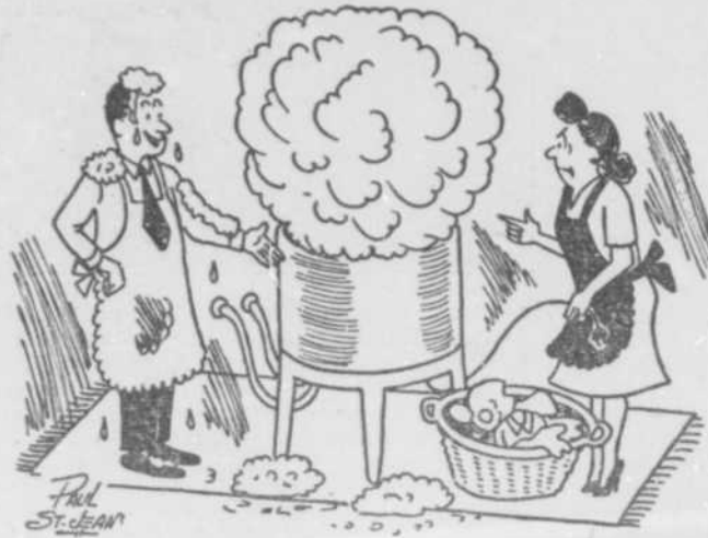
REGARDE CETTE MOUSSE, J'AI MÉLANGÉ DU LUX, DU PALMOLIVE, DE L'OXYDOL, DU DUZ ET CAMAY, DU SUNLIGHT, DU DREFT ET SPIC & SPAN, DU RINSO ET DE L'IVORY! EN UN MOT, JE T'AI FAIT UN MÉLANGE SAVONNEUX À LA "CBF"!