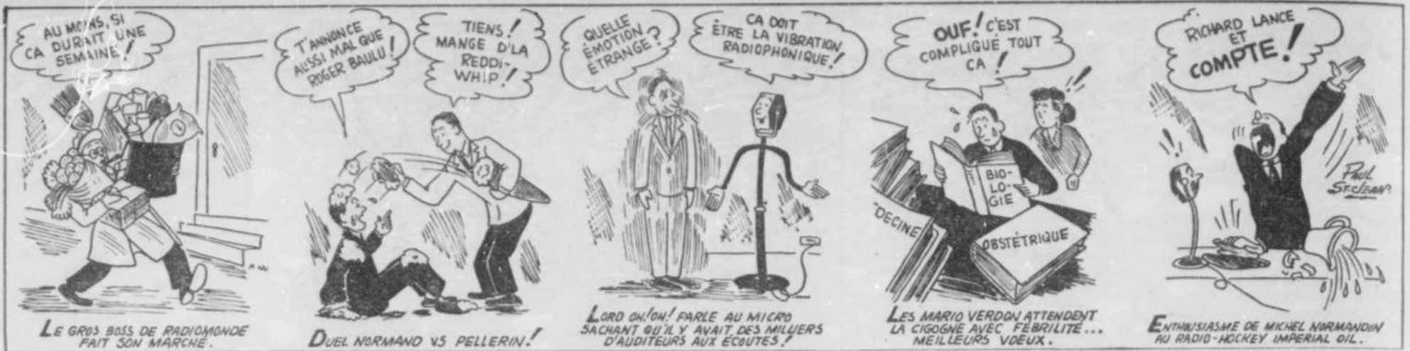
LE GROS BOSS DE RADIOMONDE FAIT SON MARCHÉ.