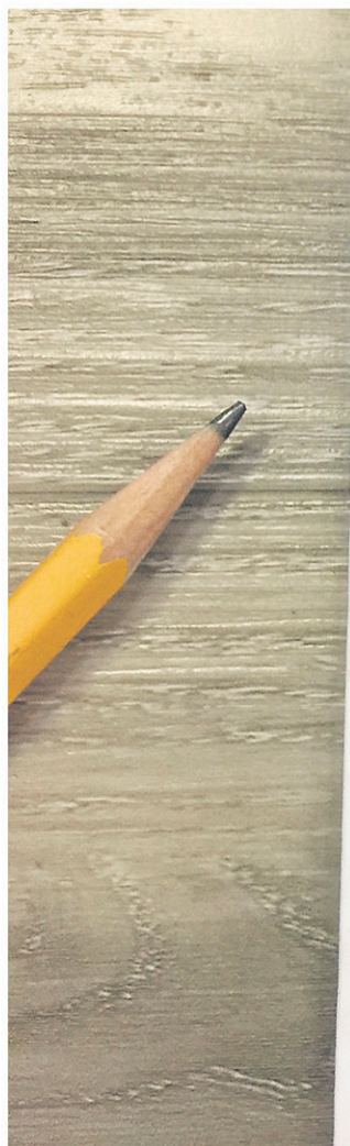
— ISABELLE GABORIAULT

Ce genre de mutation, imperceptible sur une courte durée, est rendue possible grâce à la vidéo en time-lapse (ou en accéléré). Ce sont de petits films bricolés en mettant bout à bout des photographies prises à intervalles réguliers. Une technique parfaite pour montrer des trucs qui s'étirent dans le temps.