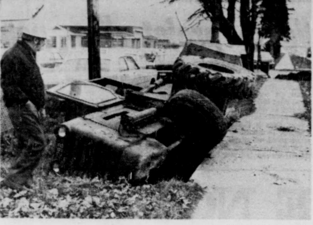
CET ENGIN QUI SERT dans les travaux de construction et de voirie s'est engouffré dans un trou profond, à proximité de la Damtar, hier matin, vers 11 heures. Il a fallu utiliser d'autres puissantes machineries afin de sortir celle-ci de sa fâcheuse position. Le conducteur s'en est tiré indemne.