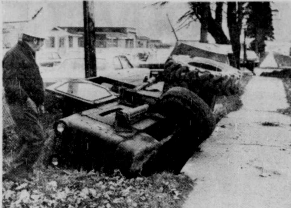
CET ENGIN QUI SERT dans les travaux de construction et de voirie s'est engouffré dans un trou profond, à proximité de la Dantar, hier matin, vers 11 heures. Il