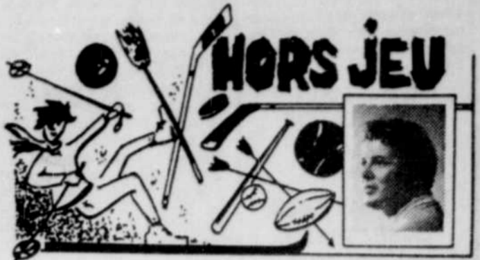
par Michel ROCHON

C'est pourquoi il lui apparaît comme inévitable d'envisager la régionalisation des services. M. Lévesque ne voit pas celle-ci avant de nombreuses années encore. Il faudra cependant commencer à effectuer les démarches nécessaires à cette régionalisation.