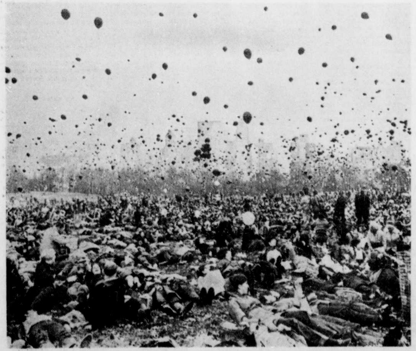
LA MARCHE CONTRE LA MORT qui a débuté jeudi au cimetière national d'Arlington, près de Washington, s'est poursuivie hier et ne prendra fin qu'aujourd'hui. Il s'agit du moratoire de novembre contre la guerre au Vietnam. La photo ci-dessus a été prise hier au Central Park de New York alors que les protestataires ont lancé en même temps des centaines de ballons dans les airs.