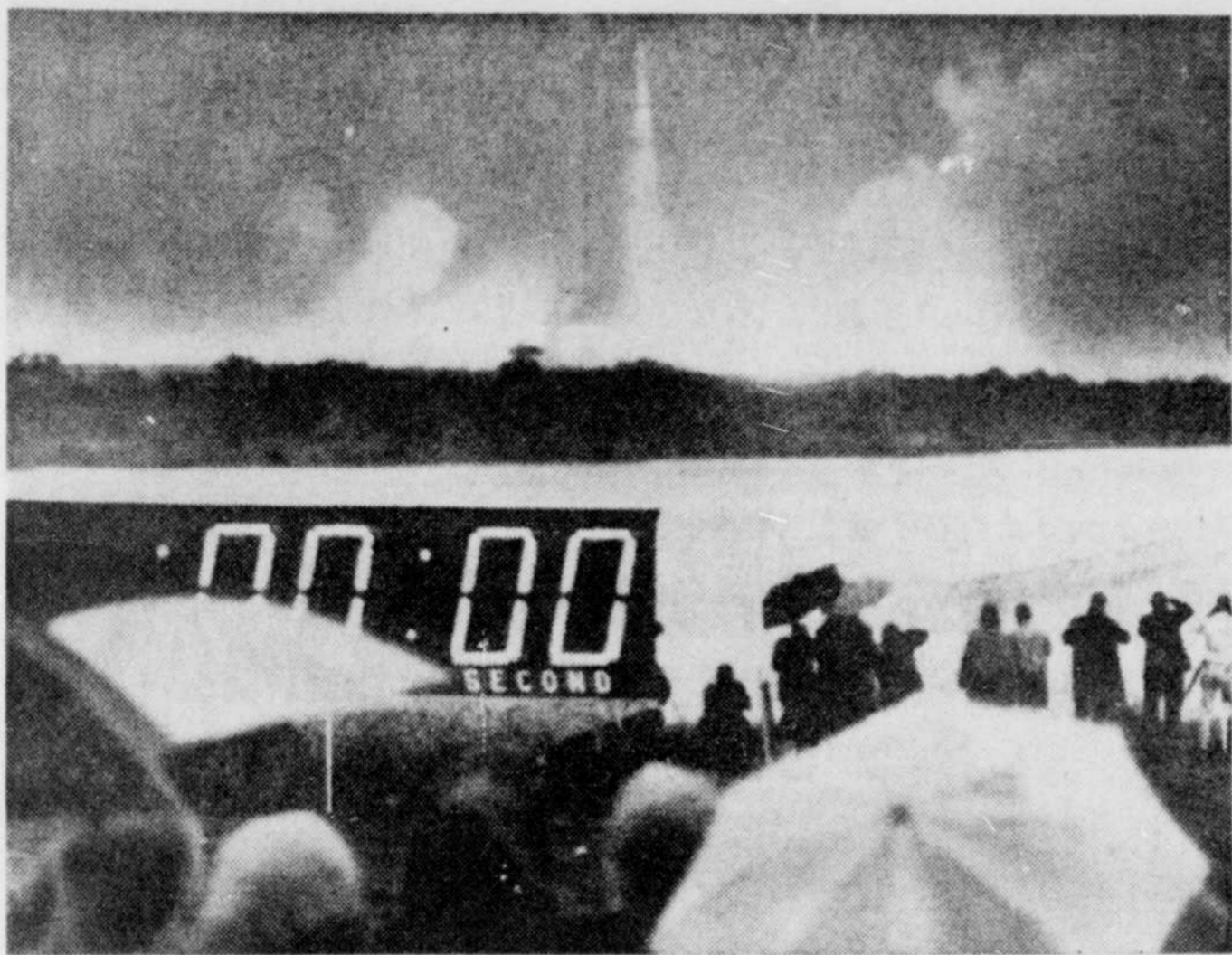
LA TERRE TREMBLE — DURANT 80 SECONDES, hier, la terre a tremblé à Cap Kennedy, à l'occasion du lancement de la capsule Apollo-12. Il pleuvait quand la fusée Saturne a été mise à feu. La photo ci-dessus prise à trois