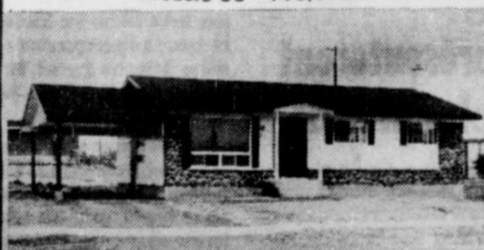
Modèle 5B - $14,550.