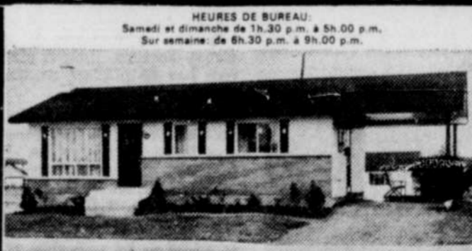
Modèle 15A - $13,950.