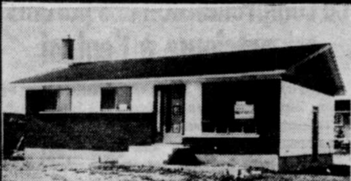
Modèle 55 - $13,350.

935 D'AVAUGOUR — BUREAU — TÉL.: 378-4380