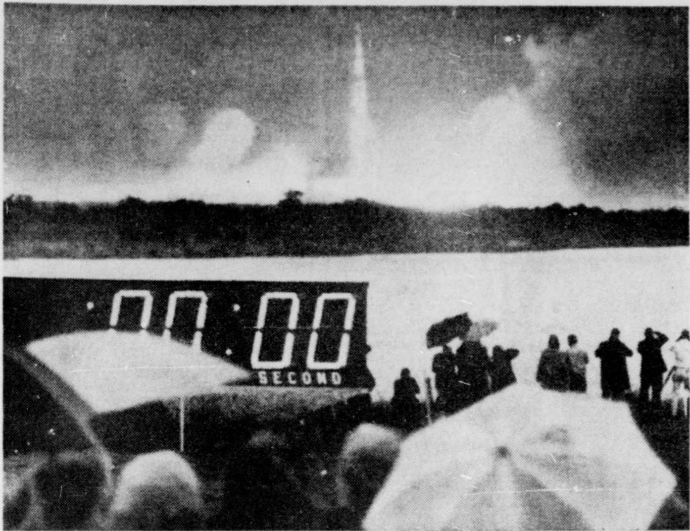
LA TERRE TREMBLE — DURANT 80 SECONDES, hier, la terre a tremblé à Cap Kennedy, à l'occasion du lancement de la capsule Apollo-12. Il pleuvait quand la fusée Saturne a été mise à feu. La photo ci-dessus prise à trois