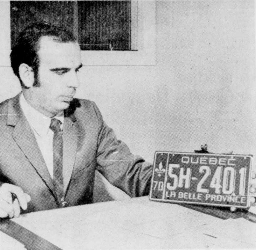
C'EST A COMPTER de lundi le 17 novembre que les automobilistes pourront commencer à se procurer leurs plaques d'immatriculation pour l'année 1970. On voit