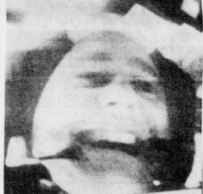
LE COSMONAUTE ALAN BEAN, qui doit piloter le module lunaire, sourit durant une conversation avec les dirigeants du centre spatial de Houston, Texas. La photo a été relayée à la terre peu après le lancement de la capsule Apollo-12.

Le troisième étage de la fusée a alors été abandonné et le train spatial n'est plus constitué que par la cabine de commandement Yankee Clipper toujours unie au module de service et par le module lunaire Intrepid.