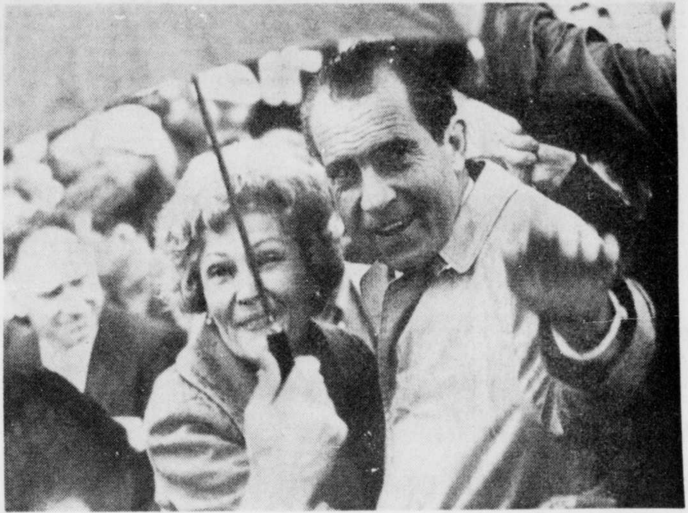
MALGRE LA PLUIE, le président des Etats-Unis, M. Richard Nixon, accompagné de sa femme, Pat, a assisté hier, à Cap Kennedy, au lancement de la capsule Apollo-12 en direction de la lune.

Au total, les prises de vues de télévision sur la lune dureront 25 heures.