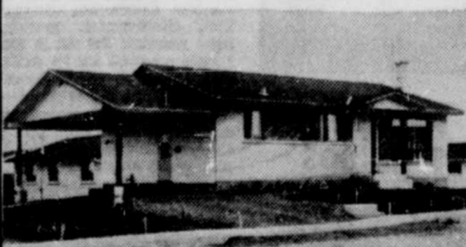
Modèle 65A - $15,550