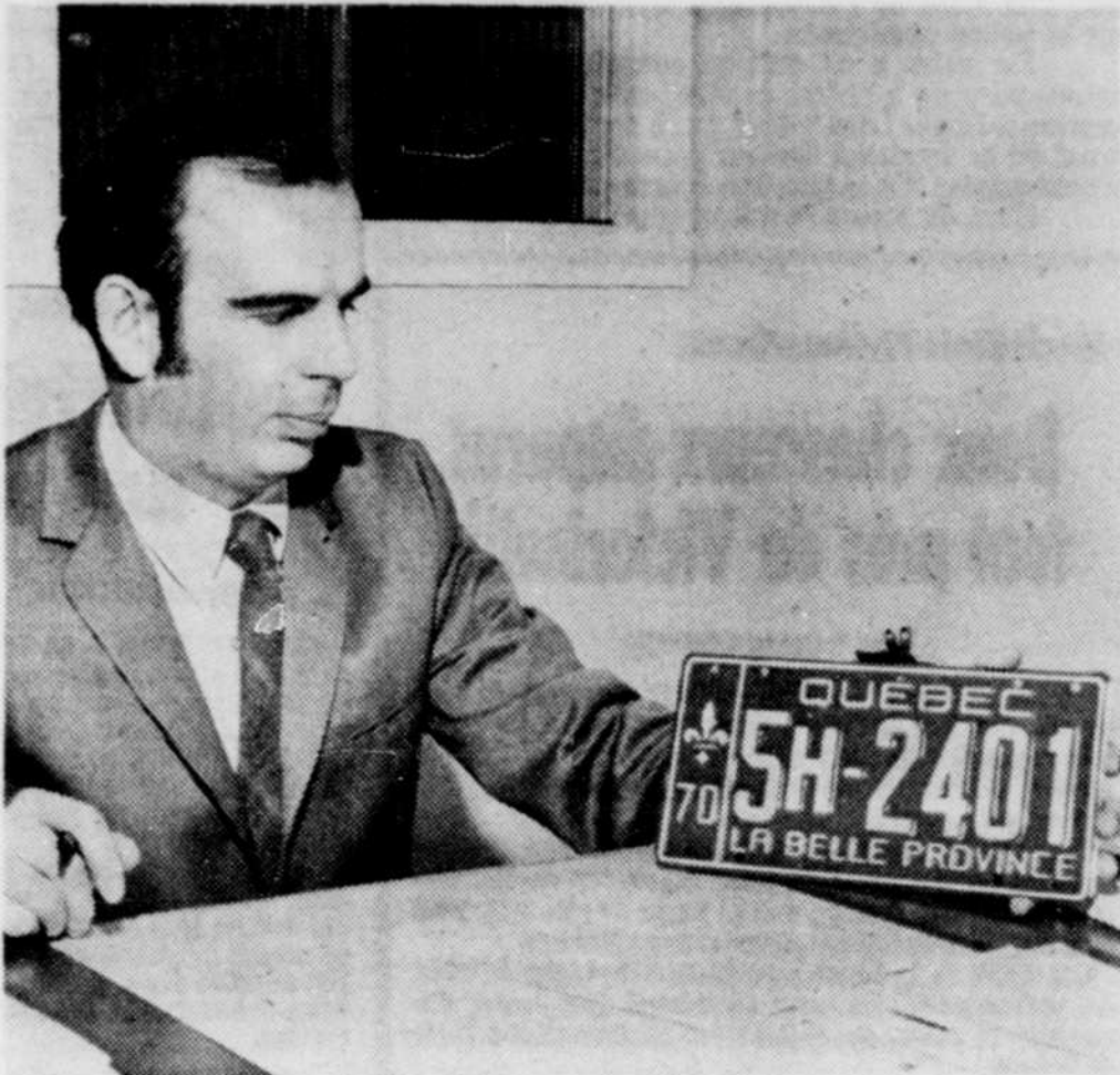
C'EST À COMPTER de lundi le 17 novembre que les automobilistes pourront commencer à se procurer leurs plaques d'immatriculation pour l'année 1970. On voit