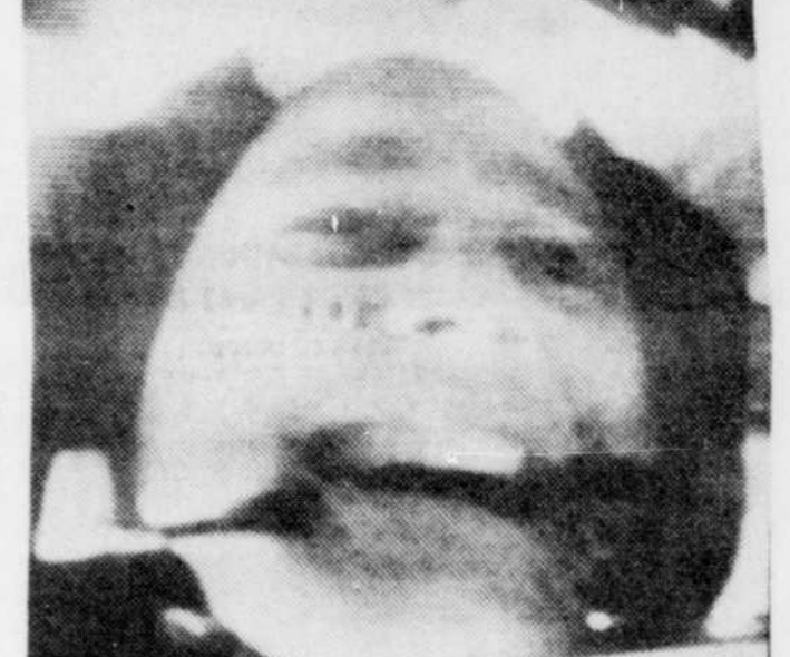
LE COSMONAUTE ALAN BEAN, qui doit piloter le module lunaire, sourit durant une conversation avec les dirigeants du centre spatial de Houston, Texas. La photo a été relayée à la terre peu après le lancement de la capsule Apollo-12.

Moins tendus L'opération de transposition s'est effectuée en diverses phases: La capsule de commande et le module de service se sont séparés du LEM et de la fusée. La première a effectué un tour de 180 degrés et orienté son nez vers l'écouille supérieure du