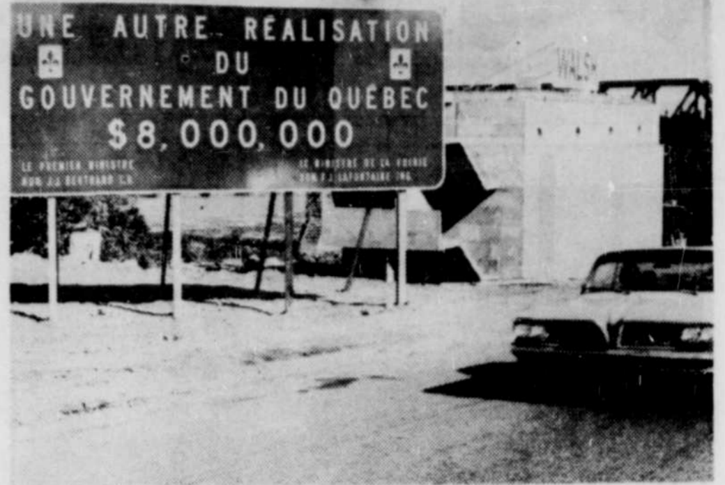
VOICI L'ANNONCE PLACEE près du pilier du nouveau pont sur le Saint-Maurice. Ce pont coûtera environ $8,000,000. Une

UNION DE PARENTS du GRAND SHAWINIGAN Dimanche 16 nov. - 8h. p.m. ÉCOLE SUPÉRIEUR SHAWINIGAN Para Gérard Gagon s.c. Psychologie du couple Adulte: $1.00 Étudiant: 50c