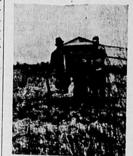
Deux des trois rescapés de la Ruisseau Hall.

déjà beaucoup de bien de cette fédération des jeunes.