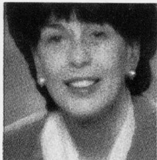
En matière de condition féminine, la ministre des Relations avec les citoyens et de l'Immigration, Michelle Courchesne, veut s'assurer que ses priorités cheminent dans les différents ministères.

« On se bat encore comme femmes pour avoir un salaire égal et pour occuper des postes d'influence nous permettant de prendre part à différentes instances décisionnelles. En matière de condition féminine, je dois m'assurer que les priorités cheminent dans les différents ministères. »