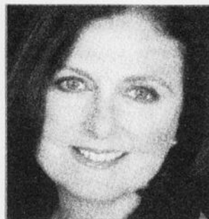
MAUREEN MC TEER

Comme elle le mentionne si bien dans son autobiographie En mon nom , publiée à l'automne dernier aux Éditions Libre Expression, non seulement a-t-elle vu changer des choses, mais elle a fait changer des choses.