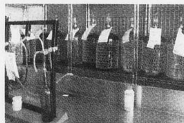
Un aperçu d'un des deux centres de vinification de Club d'Eau Plus

N'arrétant pas d'innover, elle a ouvert il y a déjà deux ans, en collaboration avec Serge Chartrand, le premier centre de vinification au Québec. Ce centre entièrement équipé permet à toute personne qui le désire de fabriquer, de laisser fermenter et d'embouteiller des Valpolicella, des Bordeaux, des Cabernet Sauvignon et bien d'autres. Des vins fabriqués bien évidemment avec l'eau distillée Odessa. Et, offerts à un prix variant entre 3 $ et 4 $ pour un vin de qualité supérieure. Qui dit mieux? Deux centres de vinification sont maintenant en opérations, chez Club d'Eau Plus inc.