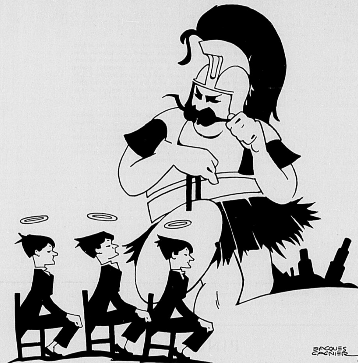
LE GROS MÉCHANT LOUP!