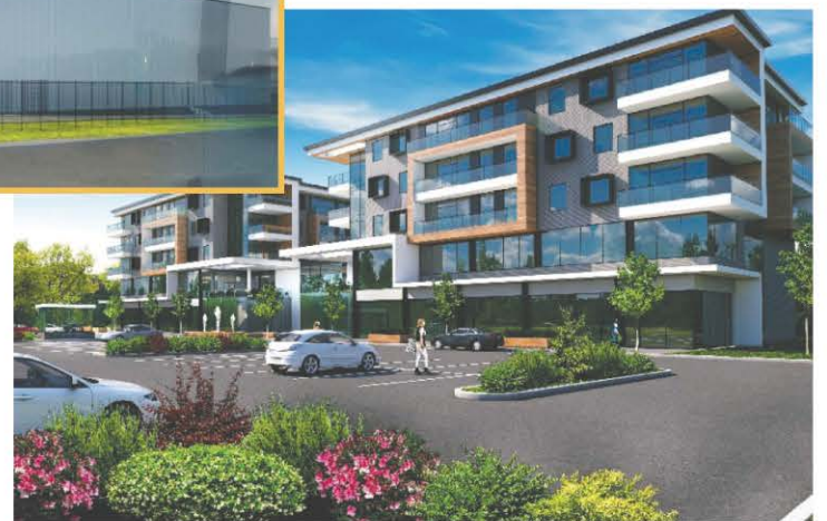
Le redéveloppement d'Industries Varennes, à l'entrée de la ville, fera place à un projet résidentiel et commercial.