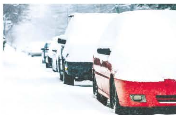
Une patrouille-neige sera mise en place et aura pour tâche d'émettre des contraventions aux propriétaires de véhicules qui dérogent au règlement de stationnement sur rue en période hivernale.