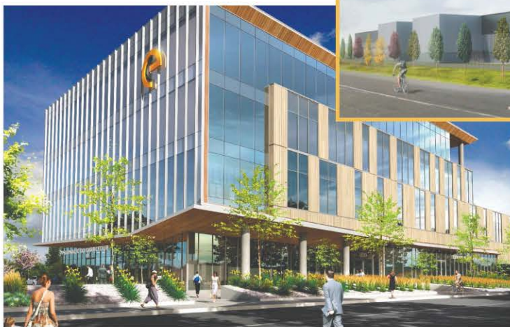
La phase 3 du Carrefour de l'Énergie, dans le Novoparc de Varennes.

Bref, si la croissance de Varennes se poursuit à un rythme aussi soutenu, il est fort possible que la municipalité de près de 21 000 habitants puisse accueillir d'ici quelques années... un milliard de dollars d'investissements privés sur son territoire!