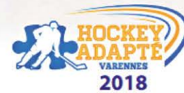
L'équipe des Blitz, hockey adapté, Varennes