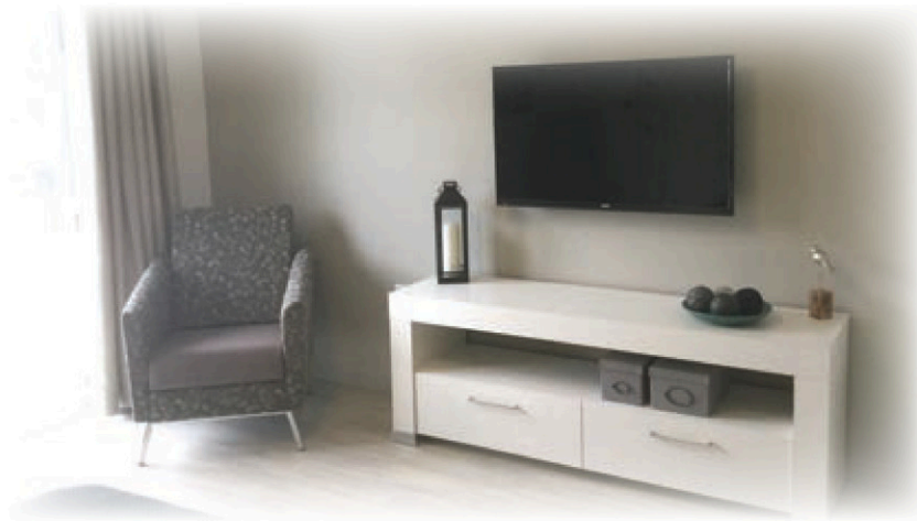
Appartement entièrement meublé et avec salle de bain complète.

spécialement adaptée pour accueillir des personnes souffrant de pertes de mémoire (Alzheimer) ou autres pertes cognitives dans un milieu de vie sécuritaire.