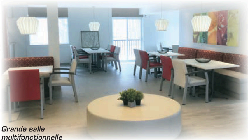
Grande salle multifonctionnelle