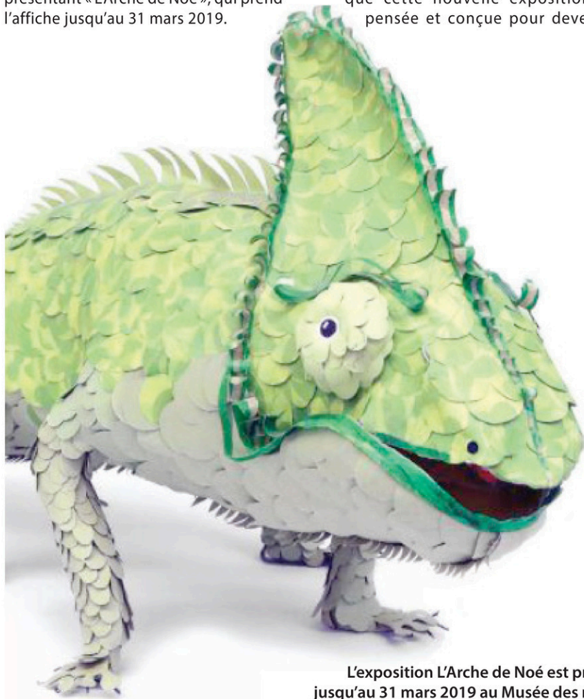
L'exposition L'Arche de Noé est présentée jusqu'au 31 mars 2019 au Musée des religions du monde de Nicolet.

« Nous sommes fiers de pouvoir faire voyager l'œuvre de Claude Lafortune », a-t-il commenté, se disant également heureux de voir, par le fait même, l'expertise et le savoir-faire de son établissement rayonner dans d'autres musées du Québec.