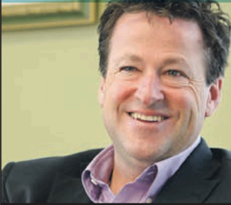
DONALD MARTEL Député de Nicolet-Béancour