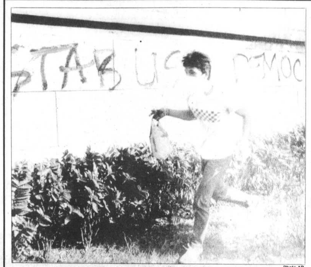
Un jeune Philippin prend soin de voiler son visage et de quitter rapidement les lieux, après avoir inscrit, sur un mur, son appel en faveur de la démocratie.