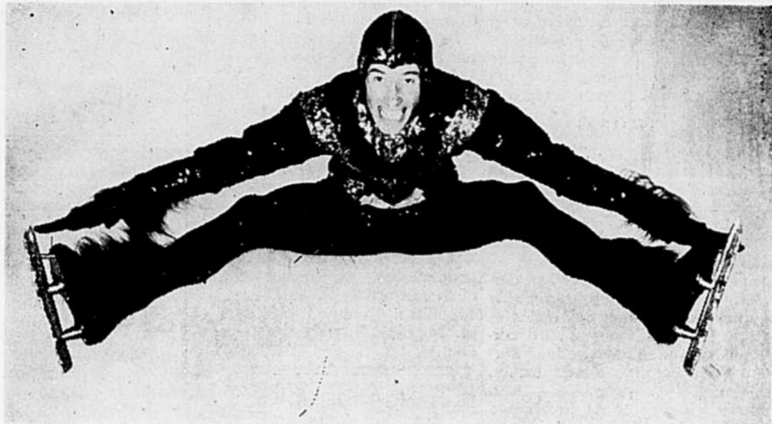
(Lire l'annonce de ce spectacle en page 4)