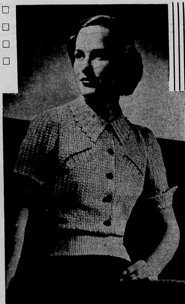
Ce charmant gilet est très facile à faire, avec du coton à tricoter mercerisé, dans un point de coquille. Frais et confortable pour l'été, il ajoutera une note personnelle à votre garde-robe et fera un agréable changement avec vos blouses tailleur.

1er rang: 7 br. dans la 4ième chaîne, à partir du crochet, tr. 1, passez 3, 1 m. s. dans la chaîne suivante, tr. 1, passez 3, 7 br. dans la m. suivante,