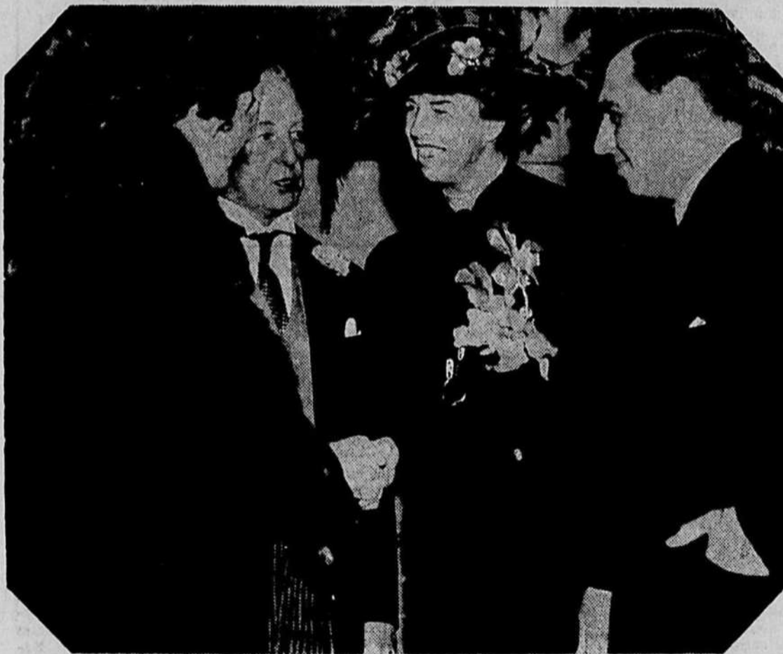
Madame Frank D. Roosevelt a arboré son plus charmant sourire pour recevoir ses nombreux invités, lors d'un thé donné à New York.

Les élèves de l'Ecole Navale américaine paraded à Annapolis, Md., en l'honneur d'un groupe de visiteurs distingués. On voit ici le régiment, disposé en compagnies, sur le champ de parade.