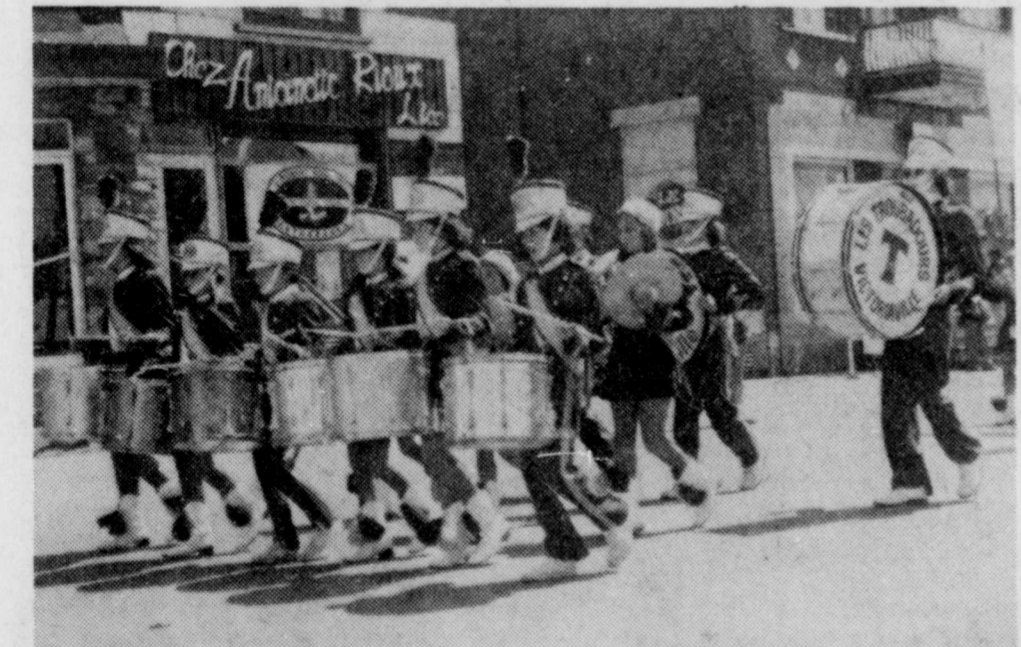
Les Troubadours comptent deux fois plus d'instruments que les groupes ordinaires et c'est là un secret de leur rendement après aussi peu de temps d'activités. On voit ici une partie du groupe lors d'une sortie à Victoriaville.