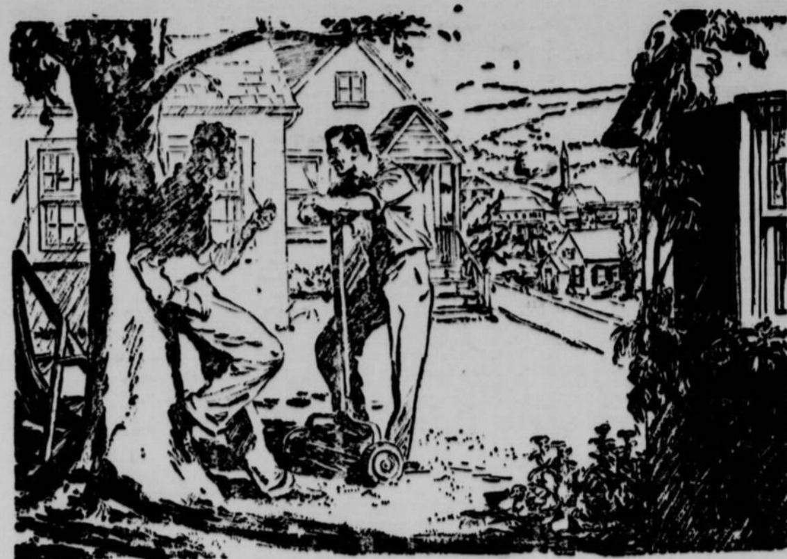
LES CANADIENS ET LEURS INDUSTRIES—ET LEUR BANQUE

La partie de balle molle entre les clubs Hôtel Globe-Samson, de