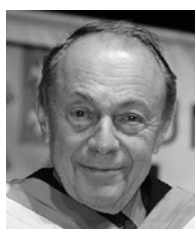
MICHEL ROCARD Homme politique français et écrivain Docteur d'université honoris causa