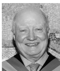
JEAN-PAUL COSTA Président de l'Institut international des droits de l'Homme et ancien président de la Cour européenne des droits de l'homme Docteur d'université honoris causa