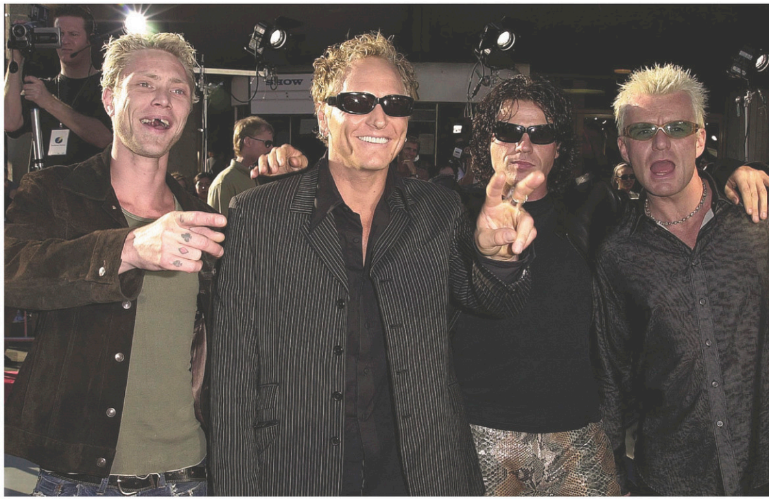
Les membres de The Cult en 2000 à Los Angeles

Et quels succès! La trilogie des albums Love (1985), Electric (1987) et Sonic Temple (1989) renfermait les plus grandes chansons du groupe, comme