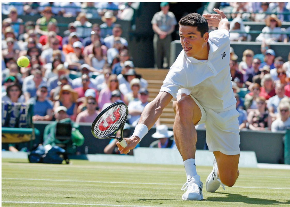
Milos Raonic a vaincu Sam Querrey pour passer en demi-finales.