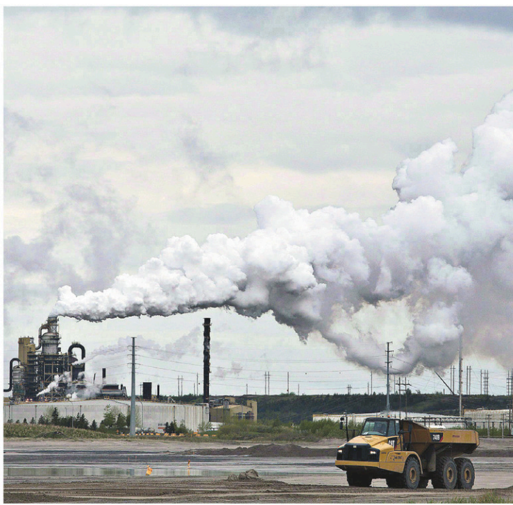
Les exportations de pétrole brut et de bitume ont progressé malgré les incendies de forêt dans la région de Fort McMurray.