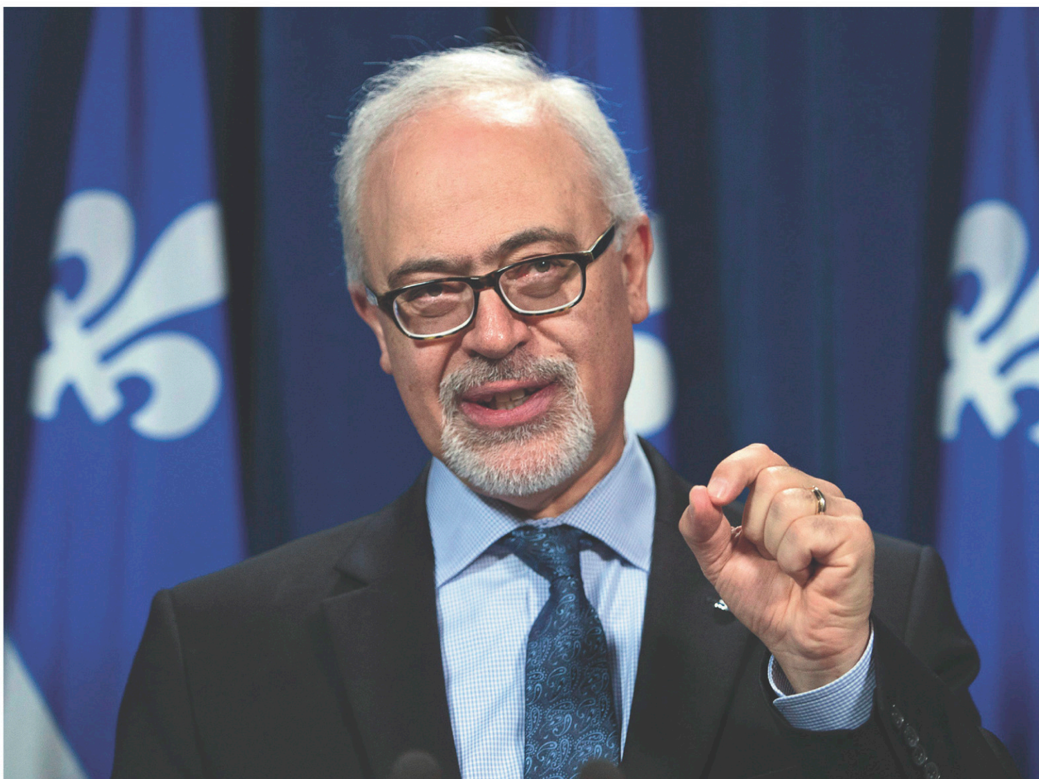
Carlos Leitão a écarté la possibilité d'annuler les récentes compressions de 200 millions $ dans le réseau de la santé. Par contre, comme il prépare déjà le budget de 2017-2018, un réinvestissement serait alors envisagé.