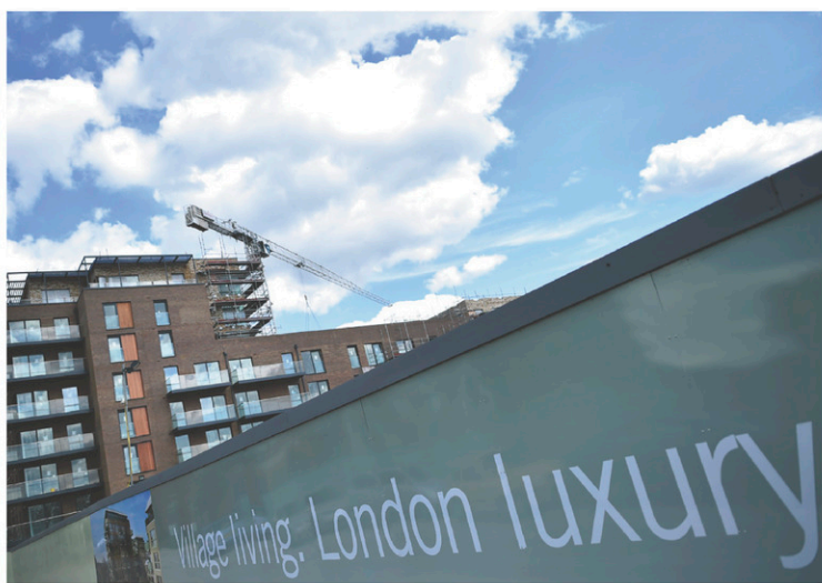
La Banque d'Angleterre a souligné mardi que certains segments du marché, notamment sur le marché haut de gamme de Londres, étaient tendus.

« Plus de la moitié des fonds immobiliers britanniques sont