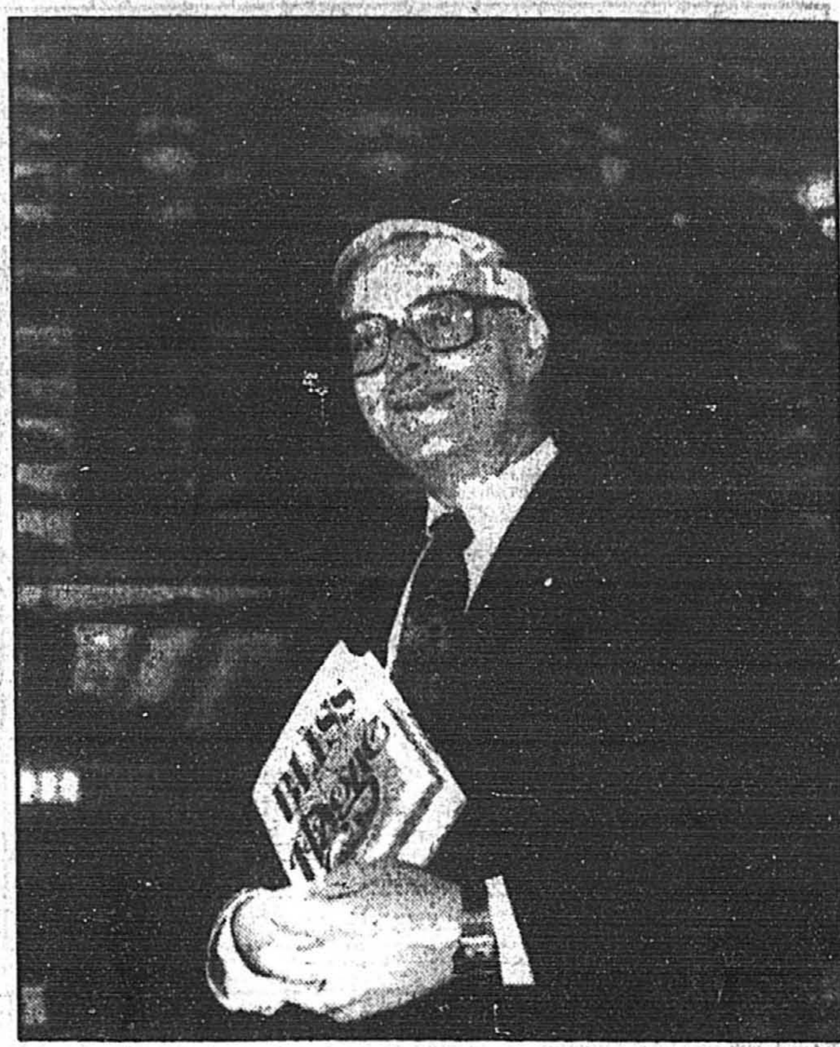
L'historien Michael Bliss décrit l'épidémie de vérole à Montréal avec beaucoup de réalisme.

«Il y a même une fin heureuse. La variole a été éliminée de la surface du globe.»