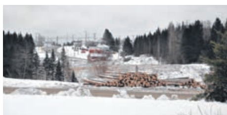
Les travaux de déboisement se termineront au cours des prochaines semaines.