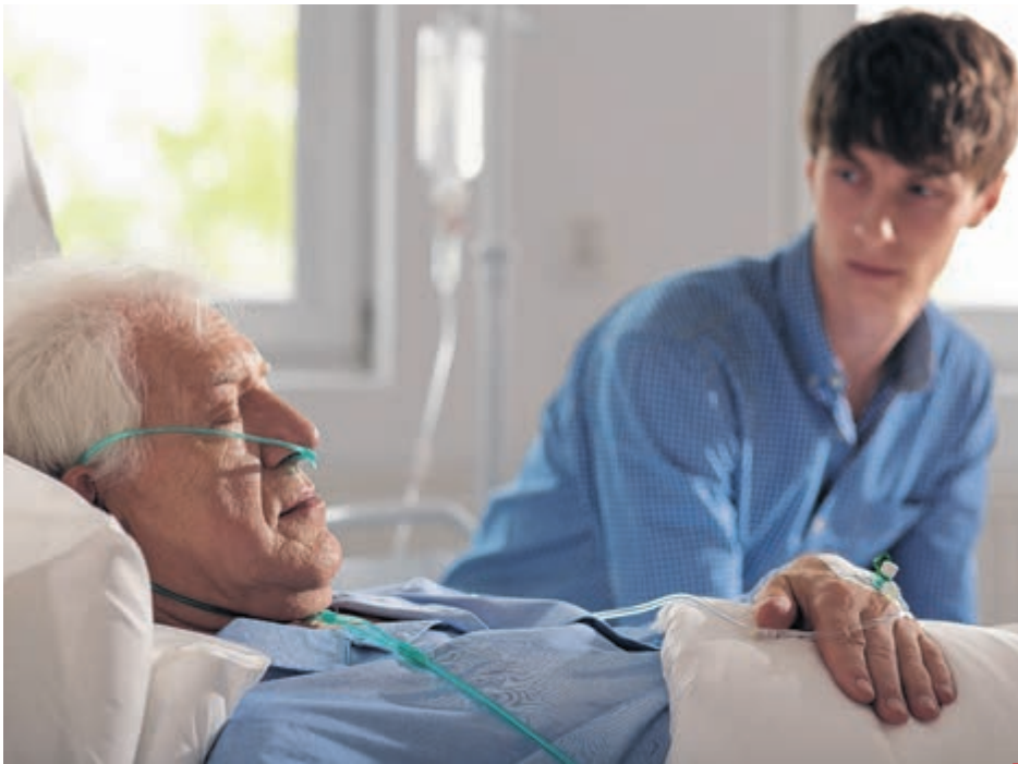
Du 10 juin 2016 au 9 juin 2017, 992 demandes ont été faites partout en province, mais seulement 62% d'entre elles ont été retenues.

En 2017, on compte 58 infirmières auxiliaires du CISSS de la Gaspésie qui ont reçu une formation de 10 heures sur l'aide médicale à mourir, où il a été question des relations avec la personne en soins palliatifs et ses proches. La collaboration avec l'équipe interdisciplinaire affectée à une personne en soins palliatifs a aussi été abordée. Une cinquantaine d'infirmières autorisées ont également suivi la formation en approche palliative. Le CISSS de la Gaspésie entend enfin offrir davantage de formation à l'ensemble de ses professionnels au fur à mesure que le ministère de la Santé donnera de nouvelles orientations à ce sujet.