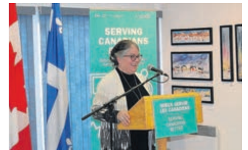
La ministre Diane Lebouthillier lors de cette annonce à Sainte-Anne-des-Monts.

Par ailleurs, les citoyens qui ont des revenus fixes année après année pourront se prévaloir du service de déclaration de revenus par téléphone. Ce service s'adresse à 950 000 Canadiens qui déclarent les mêmes revenus chaque année, comme