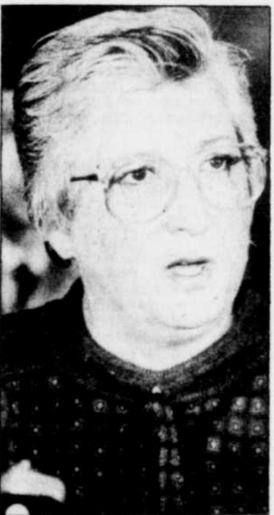
La ministre Pat Carney

"Etant donné cette situation, a expliqué Mme Carney, nous avons choisi la solution la meilleure pour le Canada." Le produit de la taxe de 15 pour cent - plus de $500 millions - sera remis aux provinces qui pourront les utiliser pour des activités de silviculture, de reboisement et de recyclage des travailleurs ou pour d'autres activités relevant de leur juridiction.