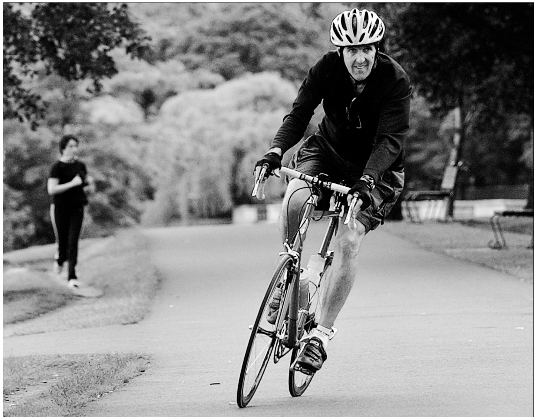
Le sénateur et candidat démocrate à la présidence américaine, John Kerry, roule à vélo dans les rues de Boston, au Massachusetts.

Sur le terrain, 18 Palestiniens, dont deux jeunes femmes, ont été arrêtés hier par l'armée israélienne en Cisjordanie.