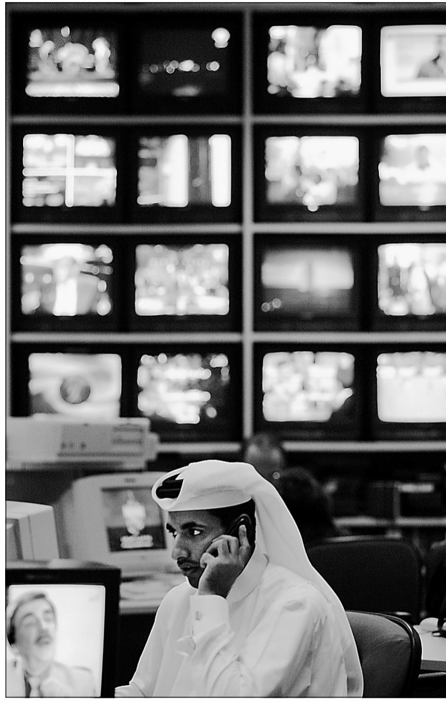
Un employé de la salle de nouvelles d'Al-Jazira vaque à ses occupations. Le CRTC a décidé hier de permettre la diffusion de la chaîne au Canada.