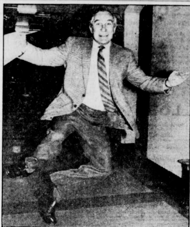
L'ex-ministre libéral Bud Cullen bondissait littéralement de joie, hier, en apprenant que la remontée de son parti se concrétisait auprès des électeurs canadiens.