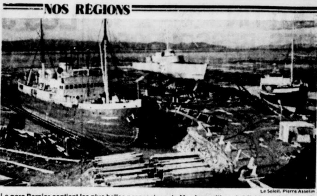
Le parc Bernier contient les plus belles possessions du Musée maritime de L'Islet-sur-Mer.