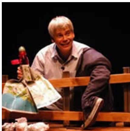
Léon le nul , une coproduction du Théâtre de la Pire Espèce et du Théâtre Bouches décousues.