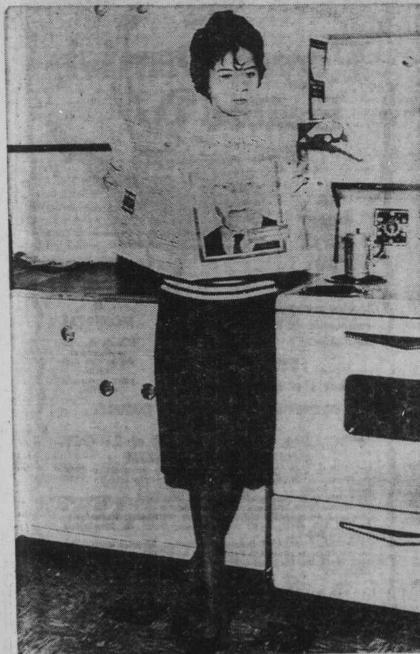
L'actualité : L'Express (et toute la vérité sur la guerre d'Algérie)