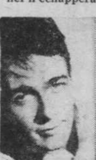
Jacques Charrier ... le mari

Le réalisateur JACQUES DUPONT termine présentement, à Paris, le tournage de "Les distractions", mettant en vedette JEAN-PAUL BELMONDO, ALEXANDRA STEWART et SYLVIA KOSCINA. Ce film raconte l'histoire de deux amis séparés par la vie; quand le hasard les remettra en présence, l'un sera devenu un dévoyé traqué par la police, tandis que l'autre occupera une honorable situation. Le second aidera le premier jusqu'à ce qu'une femme intervienne pour les brouiller à tout jamais. Mais la loi reste la loi. Le criminel n'échappera pas au châtiement.