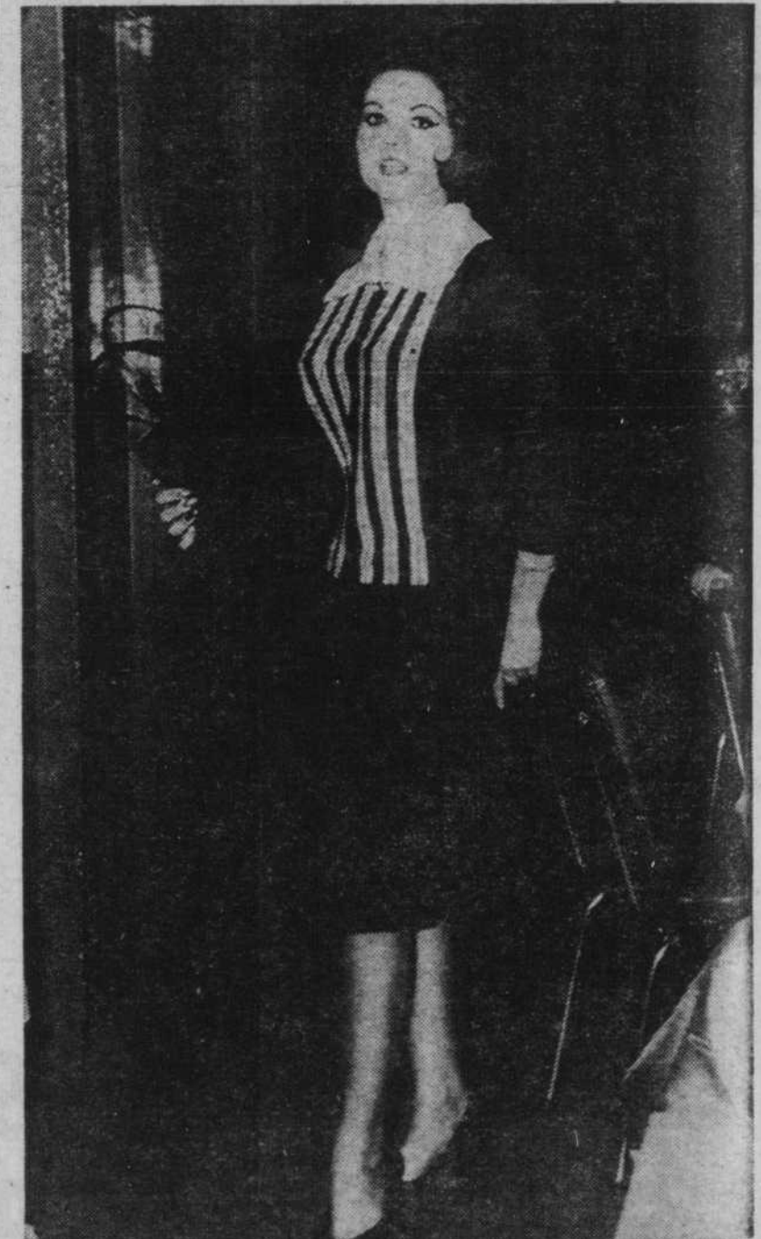
Ce deux pièces en laine Tricosa de Montréal est parfait pour toutes les circonstances. Ces rayures feront le meilleur effet à la télévision. A noter également la magnifique bourse Tarkor, dans laquelle les artistes pourront placer jusqu'à leurs textes, sans avoir à traîner une serviette!