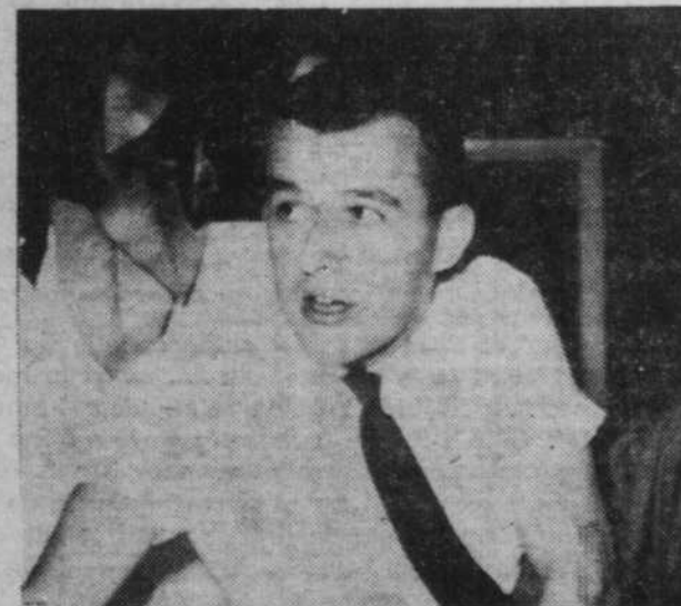
Un regard vers l'avenir!