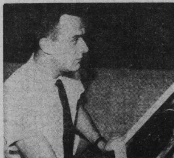
Egalement un amateur de peinture moderne.