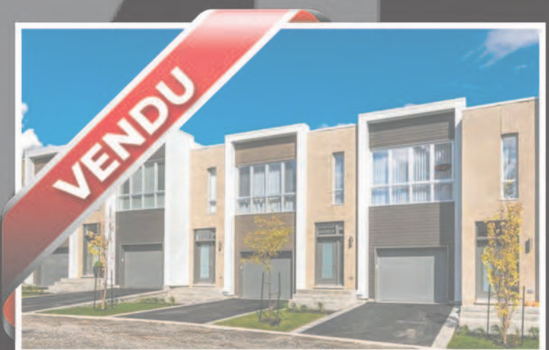
324 rang des vingt, Saint-Basile-le-Grand