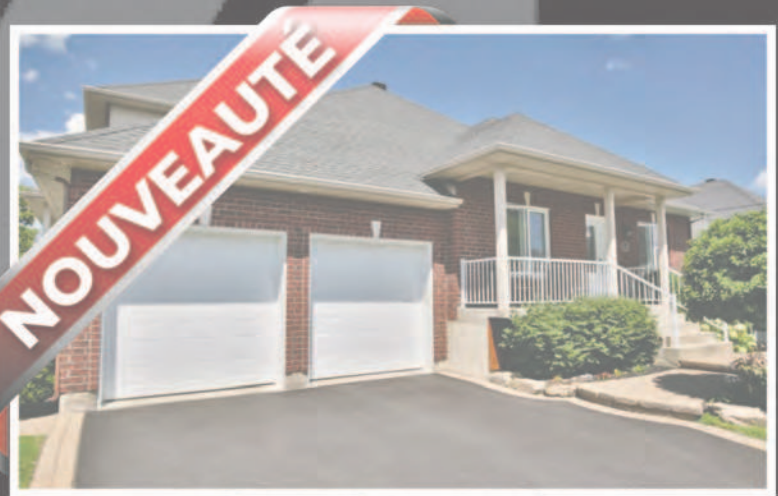
157 Rue Gédéon-Ouimet, Mont-Saint-Hilaire (# Centris 13199026)