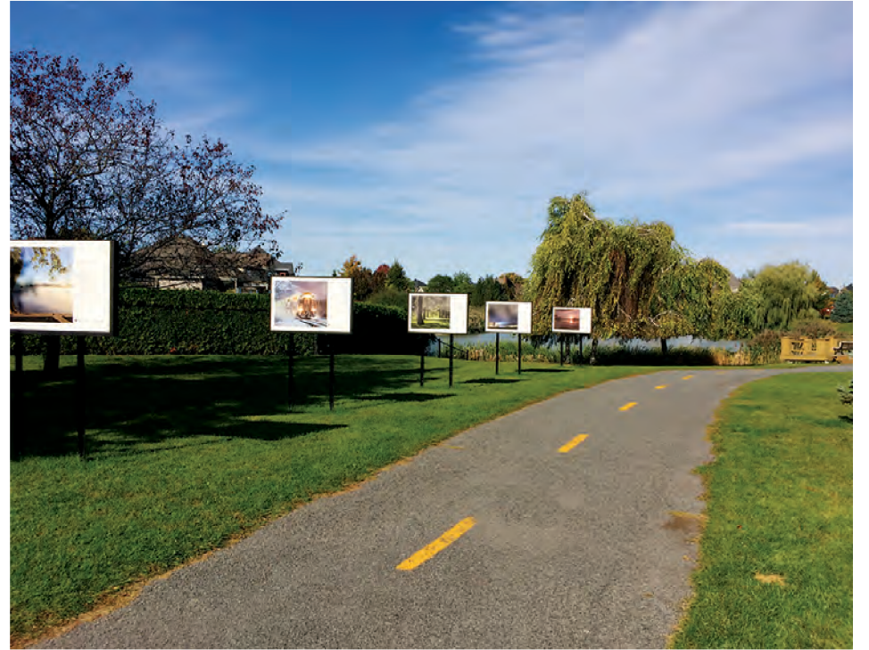
Saint-Basile-le-Grand recherche des bénévoles pour le comité de développement culturel.

Ce comité a pour mandat de trouver des moyens pour promouvoir la culture, les arts