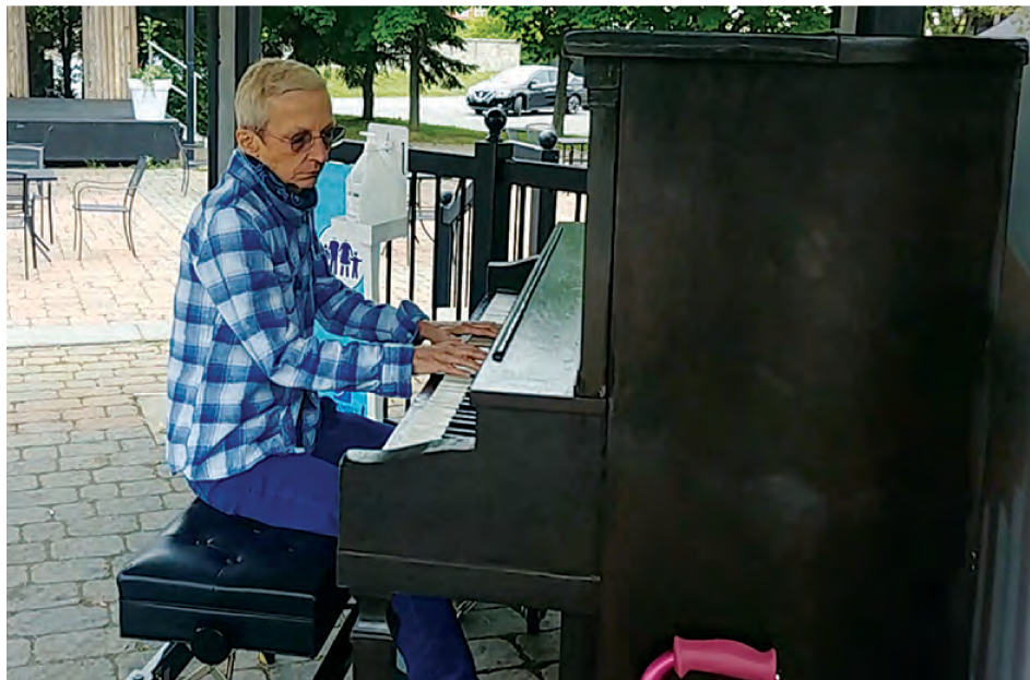
Saint-Basile-le-Grand et Chambly font partie des rares municipalités à poursuivre la tradition des pianos publics cet été.

« En conformité avec le principe d'accessibilité énoncé à sa politique culturelle, la Municipalité invite les Grandbasilloises et Grandbasillois à profiter d'un piano public en plein air, installé à la halte du village. » - Ville de Saint-Basile