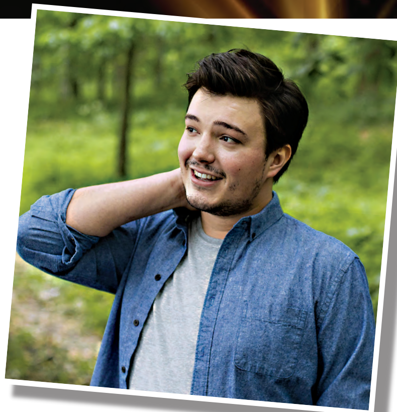
L'auteur-compositeur-interprète Émile Bilodeau sera à Saint-Basile-le-Grand le 22 août.

C'est le nombre d'années au cours desquelles ont été présentés des concerts à Saint-Basile-le-Grand pour les Dimanches sur le parvis.