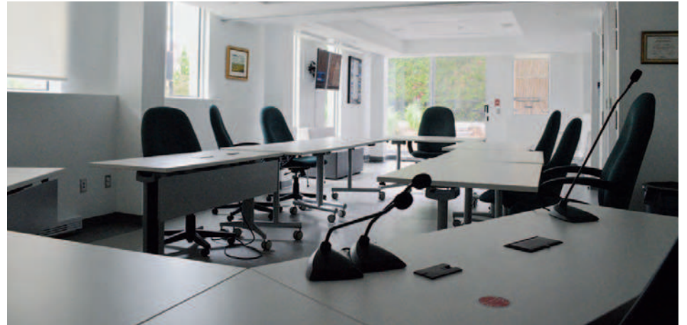
La nouvelle salle du conseil n'est pas aussi grande que celle du Centre civique Bernard-Gagnon.

Aux critiques qui pourraient ne pas comprendre la logique derrière la construction d'une nouvelle section à la mairie si le conseil ne peut même pas y siéger, le maire répond que ce sont surtout les nouveaux bureaux qui ont une importance pour Saint-Basile, qui louait depuis plusieurs années des bureaux ailleurs dans la ville pour assu-