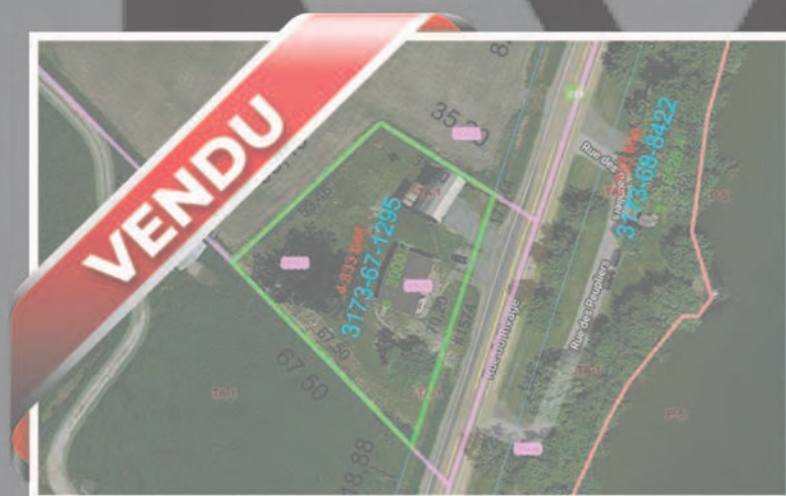
1574 Ch. du Rivage, Saint-Antoine-sur-Richelieu