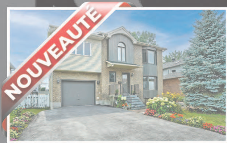
505 rue Ravel, Brossard (# Centris 28780477)