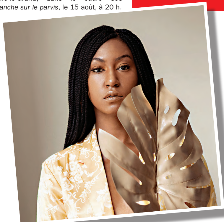
Dominique Fils-Aimé séduit partout où elle passe grâce à son charisme et à sa voix envoûtante.

Soulignons que pour permettre la tenue sécuritaire des concerts, la rue Principale sera fermée entre la montée Robert et la rue Préfontaine, de 16 h à 21 h 45 les 15 et 22 août. (FR)