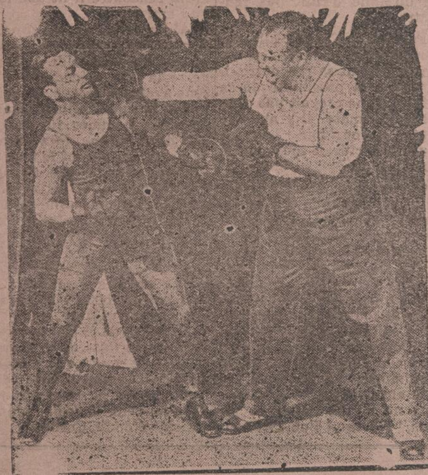
BENNY LEONARD ...