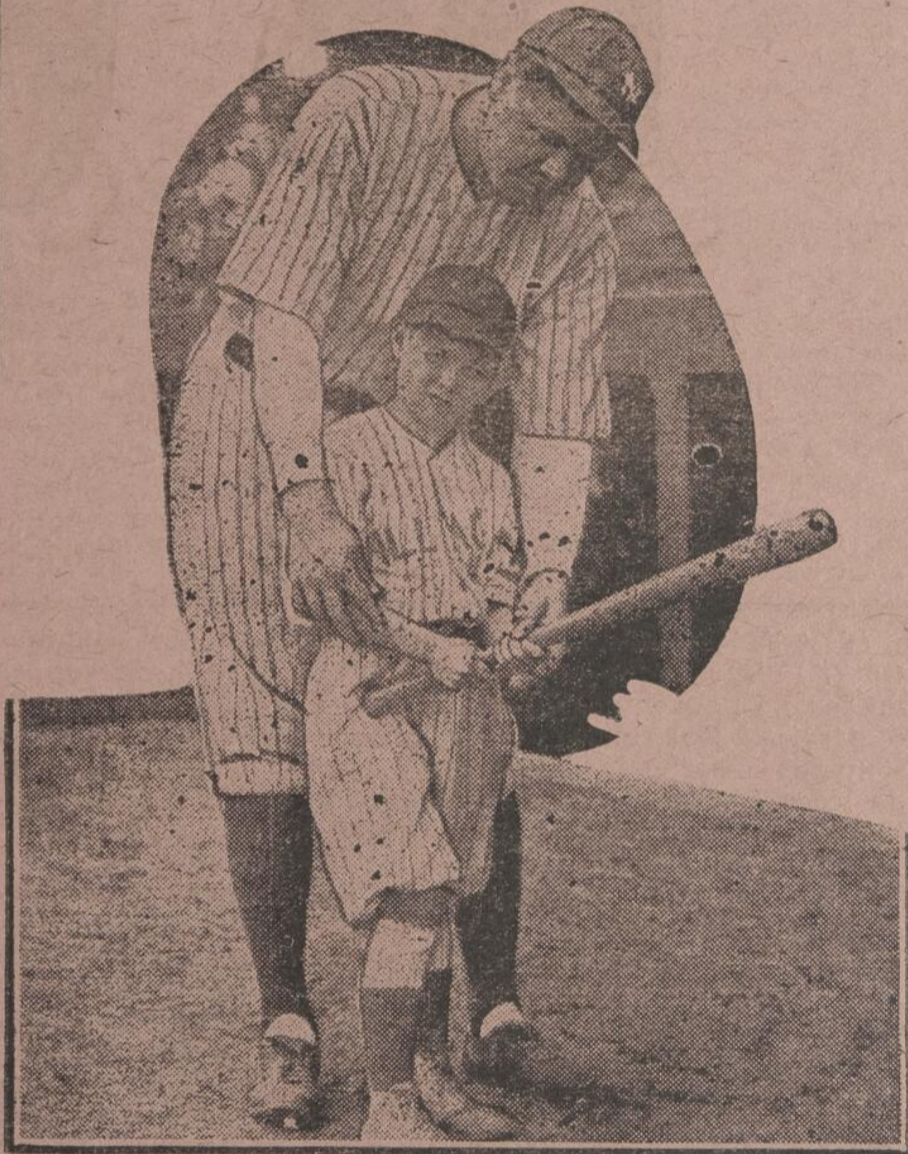
Babe Ruth et son héritier