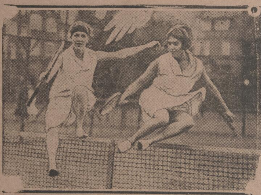
Nos Canadiennes à l'oeuvre.

Quand nous employons terme — aveugles — nous nous sommes vus. Car il nous a donné de constater, particulièrement dans une circonstance mémorable, la présence d'un aveugle dans un de ces infâmes bureaux. Voyez-vous d'ici un aveugle parier sur les courses, ne connaissant même pas les chevaux, ne pouvant ni même lire, et aller comme entraîné par une sorte d'hy-