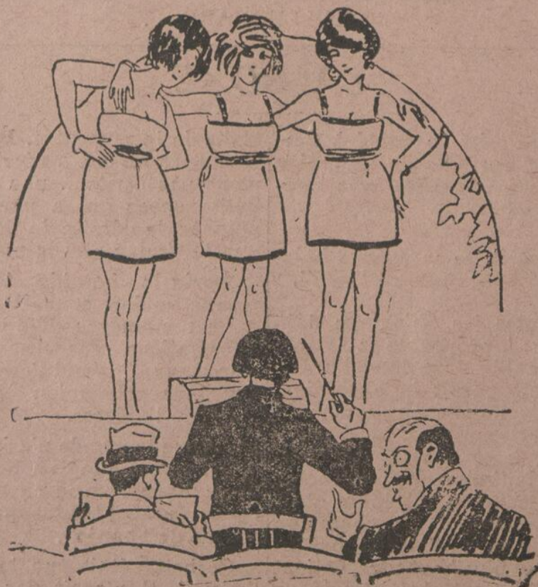
En prenant son lunch...

A partir de la 7ème ronde Fitz eut le dessus, et il était facile de voir que Corbett était énervé tant il était pâle. Enfin arrive la 15ème ronde dans laquelle le "solar plexus punch" étendit Corbett.