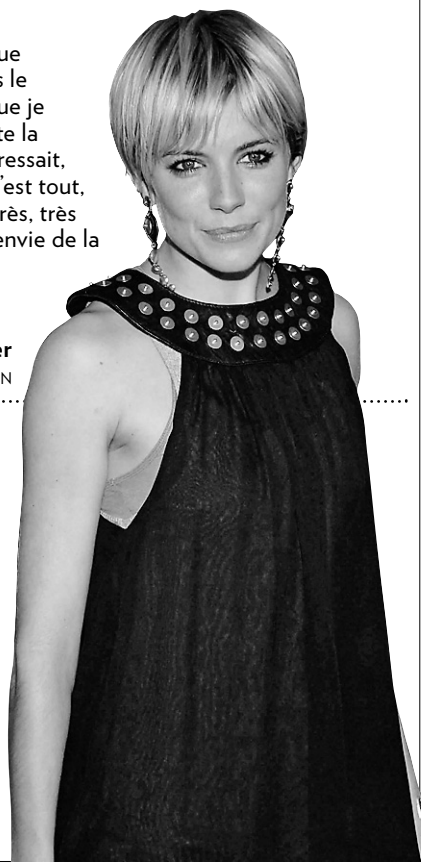
Sienna Miller