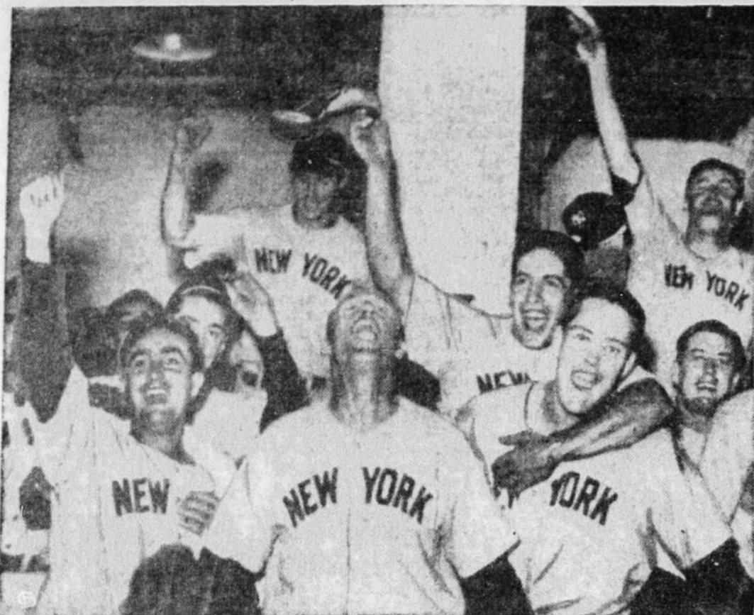
Les joueurs des Yankees de New-York ont manifesté leur joie au terme de la victoire qu'ils ont remportée récemment contre le Boston. Ce succès des Yankees leur assurait de terminer la cédule de la ligue américaine en première position et leur donnait, de fait même, le championnat pour 1941.