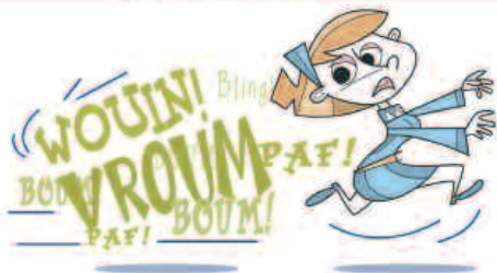
Illustration de Rémy Simard, tirée de la revue d'information Sans pépins de l'Association paritaire pour la santé et la sécurité du travail du secteur affaires sociales, volume 8, n° 2, juin 2006.